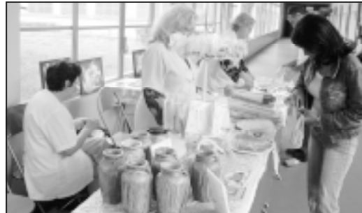
Feira quer estimular talento e o aumento da renda familiar.

O Grupo de Trabalho em Humanização (GTH) dos hospitais Padre Albino e Emílio Carlos promoveram dias 08 e 09 de maio uma Feira de Talentos, proporcionando a seus funcionários a exposição de trabalhos manuais confeccionados por eles. Na feira os funcionários expuseram artesanato, pintura, doces e salgados, bijuterias e trabalhos em tecidos, como panos de prato.