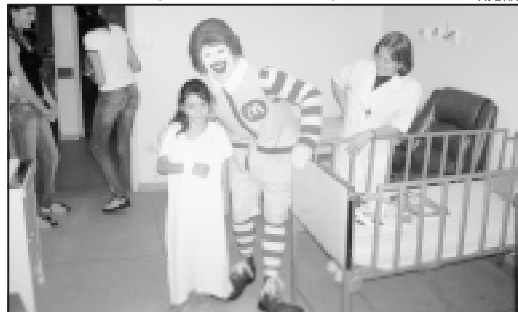
VISITA Ronald McDonald, personagem símbolo da rede McDonald's, visitou a Pediatria do Hospital Padre Albino dia 27 de abril último. O objetivo da visita foi o de proporcionar às crianças um momento de alegria, através de mágicas e brincadeiras, valorizando a fraternidade e a amizade.