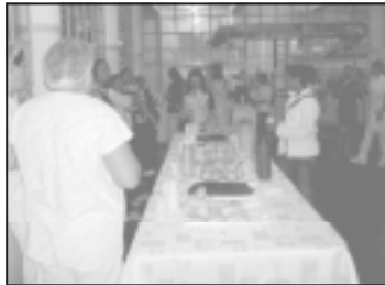
Café para as mães funcionárias dos hospitais.

Os Serviços Social, de Nutrição e Dietética e de Enfermagem e o setor de Recursos Humanos dos hospitais Padre Albino e Emílio Carlos ofereceram dia 09 de maio, das 6h30 às 7h30 e das 15h30 às 16h30, um café para suas funcionárias em comemoração ao Dia das Mães.