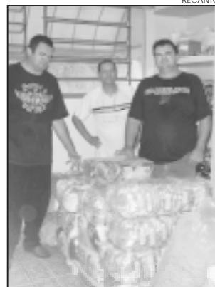
Membros da Comissão entregam os alimentos.

Todos os meses, o Grupo de Voluntárias “Amigas da Alegria”