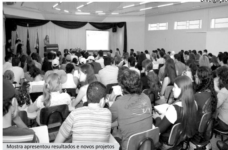
Mostra apresentou resultados e novos projetos