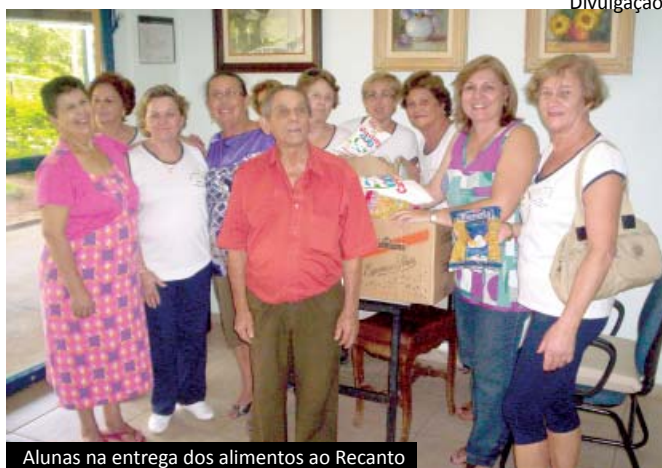
Alunas na entrega dos alimentos ao Recanto

farfura; 2 pacotes de 340g de molho de tomate; 1 quilo de sal; 2 latas de 280g de ervilha; 3 latas de 900ml de óleo; 3 litros de leite e 1 pacote de café.