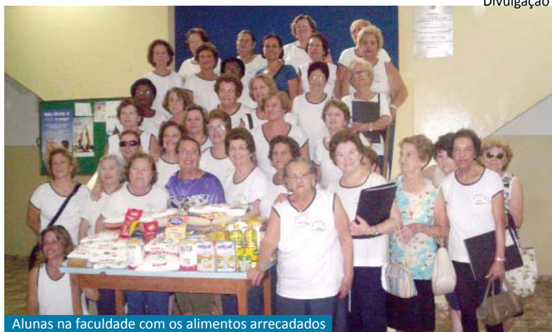
Alunas na faculdade com os alimentos arrecadados