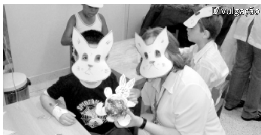
Comemoração da Páscoa na Pediatria do Hospital Padre Albino

As doações podem ser enviadas para a Rua Belém, 519, Catanduva. Contatos fone (17) 3531.3034.