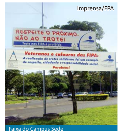
Faixa do Campus Sede

O texto das faixas dizia: Veteranos e calouros das FIPA: A realização de trotes solidários foi um exemplo de respeito, cidadania e responsabilidade social. Parabéns!