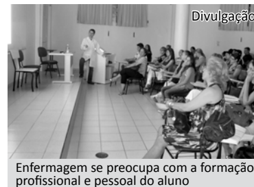
Enfermagem se preocupa com a formação profissional e pessoal do aluno

as questões que envolvem a saúde da mulher e, por isso, o curso de Enfermagem das FIPA, na disciplina “O Processo de Cuidar na Saúde da Mulher I”, também prioriza