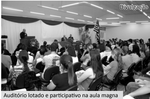
Auditório lotado e participativo na aula magna