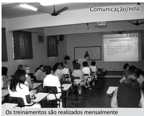
Os treinamentos são realizados mensalmente

Os treinamentos da Educação Continuada são realizados mensalmente, conforme as necessidades dos setores e o interesse dos funcionários.