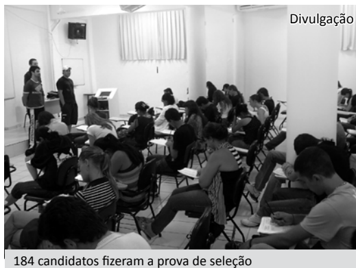
184 candidatas fizeram a prova de seleção

O projeto, iniciado em 2004, tem como parceiras a Fundação Padre Albino e a Secretaria de Educação de Catanduva.