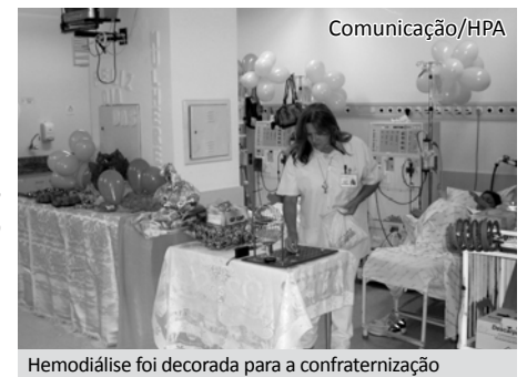
Hemodiálise foi decorada para a confraternização

Os interessados em ajudar com doações podem entrar em contato pelo telefone 17 – 3311.3034.