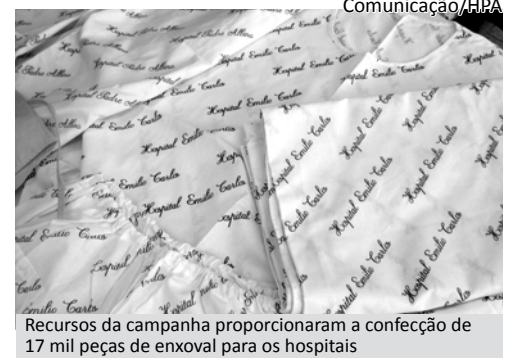
Recursos da campanha proporcionaram a confecção de 17 mil peças de enxoval para os hospitais

Mais informações sobre a campanha na Central de Telemarketing da Fundação pelo telefone 3311.3200.