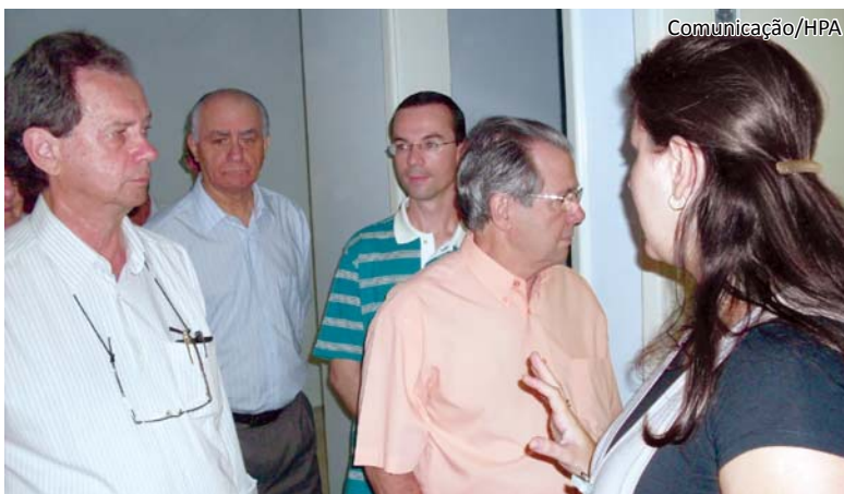
Membros da Fundação deram sequência à visita ao HPA, iniciada em novembro