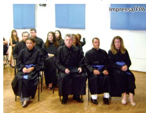
Processos Gerenciais: 2ª turma do EAD da Fundação

A Turma "Monsenhor Albino" foi composta por 11 formandos do Curso Superior de Tecnologia