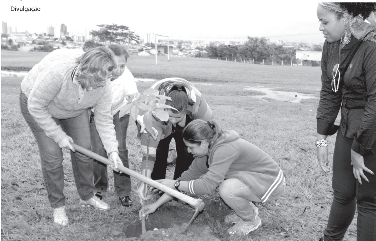
O curso plantou uma árvore no Câmpus Sede.