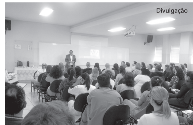
Dr. Amarante enfatizou a importância do aprimoramento profissional.

O Programa para Desenvolvimento de Líderes (PDL) da Fundação Padre Albino, iniciado em fevereiro deste ano, tem como objetivo principal promover o desenvolvimento dos líderes apresentando modernas ferramentas para gestão estratégica de pessoas.