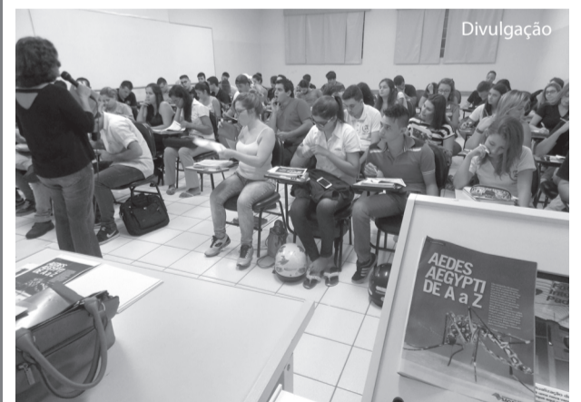
Alunos na sala de aula debatendo sobre o Aedes.

O objetivo da campanha foi unir a conscientização e mobilização da comunidade acadêmica em relação ao enfrentamento do mosquito ao conteúdo programático de algumas das disciplinas do primeiro ano do curso - Temas Contemporâneos: Textos e Contextos, Métodos e Técnicas de Pesquisa Científica e Comunicação Empresarial I, promovendo atividades interdisciplinares de leitura, reflexão, debate e produção textual.