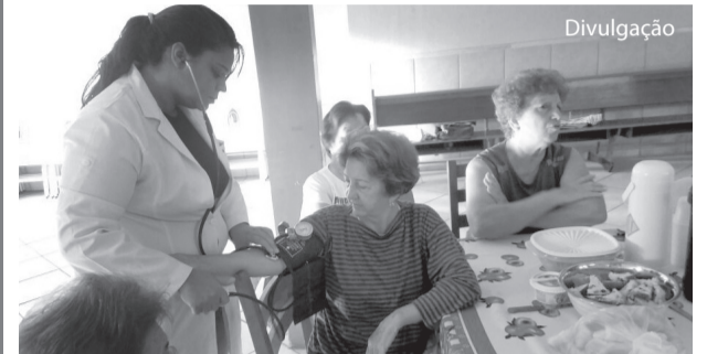
Os alunos orientaram grupo da terceira idade sobre três doenças.

Os alunos participavam do Estágio Supervisionado em Saúde Coletiva na USF Drª Isabel Etruri, no bairro Parque Flamingo.