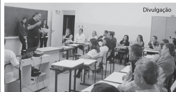
O curso participou ativamente da programação da campanha