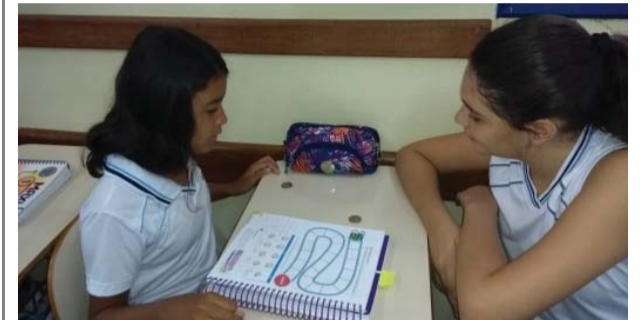
Jogo pedagógico para ampliar vocabulário.

No mesmo dia, a professora desenvolveu um jogo pedagógico com os alunos do 6º ano do Ensino Fundamental. O game chamado "Heads and Tails" (cara ou coroa) teve como objetivo a ampliação do vocabulário da língua estrangeira por meio da interação, criatividade e competição.