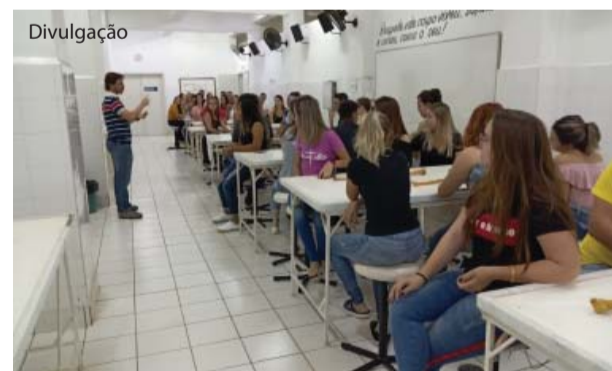
Recepção do curso de Biomedicina.