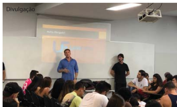
Recepção dos cursos de Educação Física.

Os calouros da Pedagogia tiveram aula normal até o intervalo, assim como as outras turmas, e depois todos se dirigiram ao Complexo Esportivo, onde foram recepcionados pelos alunos veteranos com diversas atividades. O segundo ano elaborou filme com todas as atividades de 2018; o terceiro ano apresentou o coral e as flautas e o quarto ano desenvolveu a "Atividade do abraço" e a dos "Laços", com dinâmicas para que as pessoas trocassem de pares e se abraçassem, sob o comando de música. Ao final foi feita coreografia do "Tchut tchue", com os professores do curso à frente. Na saída todos receberam marcador de página com mensagem motivacional e bombom.