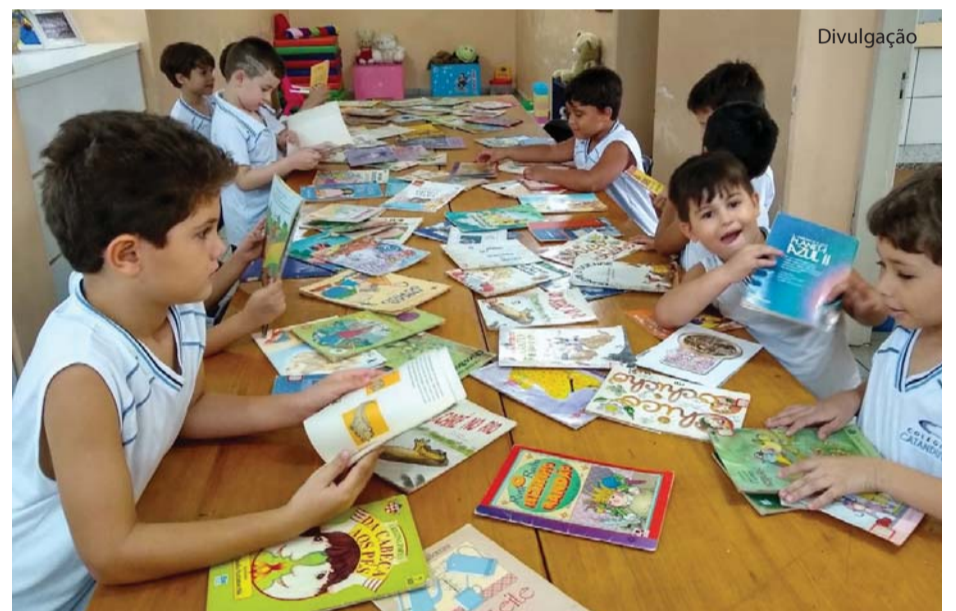
Meu livrinho da biblioteca foi um dos projetos iniciados.

O Colégio Catanduva iniciou o ano letivo com inúmeras atividades para seus alunos do Ensino Infantil e Fundamental. Entre elas, atividade artística, culto à bandeira, autorretrato, pesquisa e leitura. Página 07.