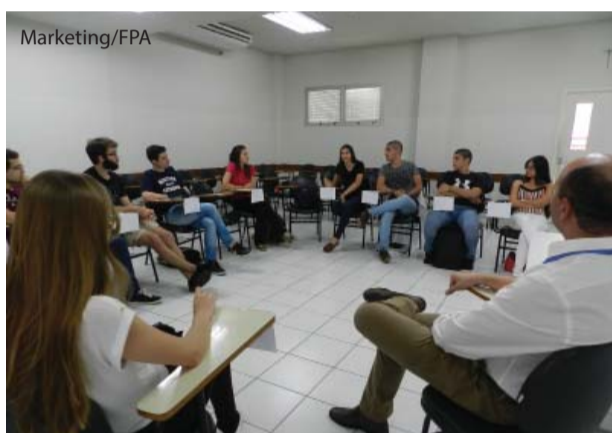
Os grupos se reúnem uma vez por mês.

O curso de Medicina da UNIFIPA iniciou em fevereiro o Programa de Mentoria de 2019 para os alu-