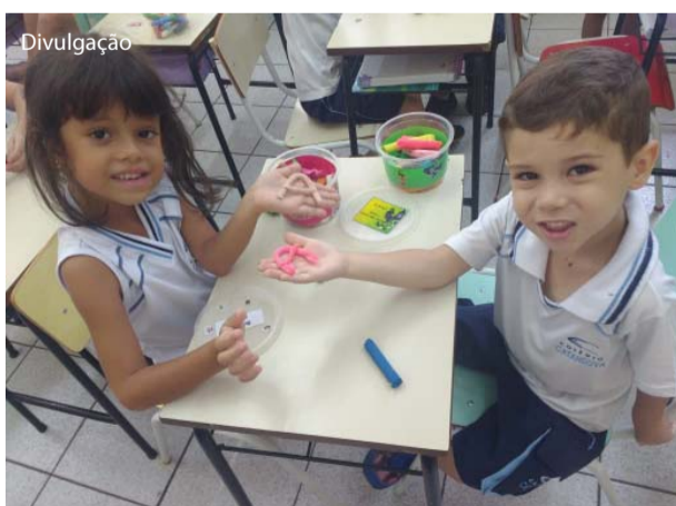
Alunos do Pré exploraram a vogal "A".

O Colégio Catanduva, através da Profª Nicole Sangalli, desenvolveu junto aos alunos do Pré II - Educação Infantil atividade de coordenação motora explorando a vogal "A" com utilização de técnicas e métodos peda-