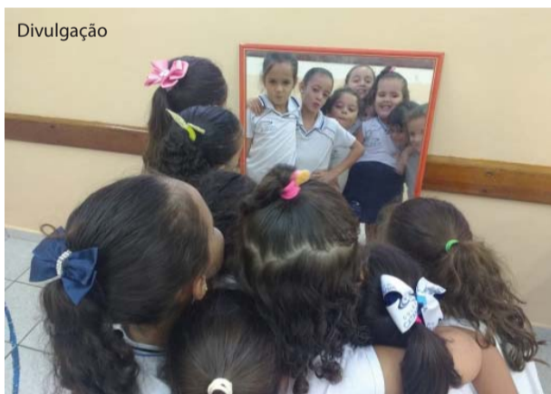
A atividade explorou o "conhecer-te".