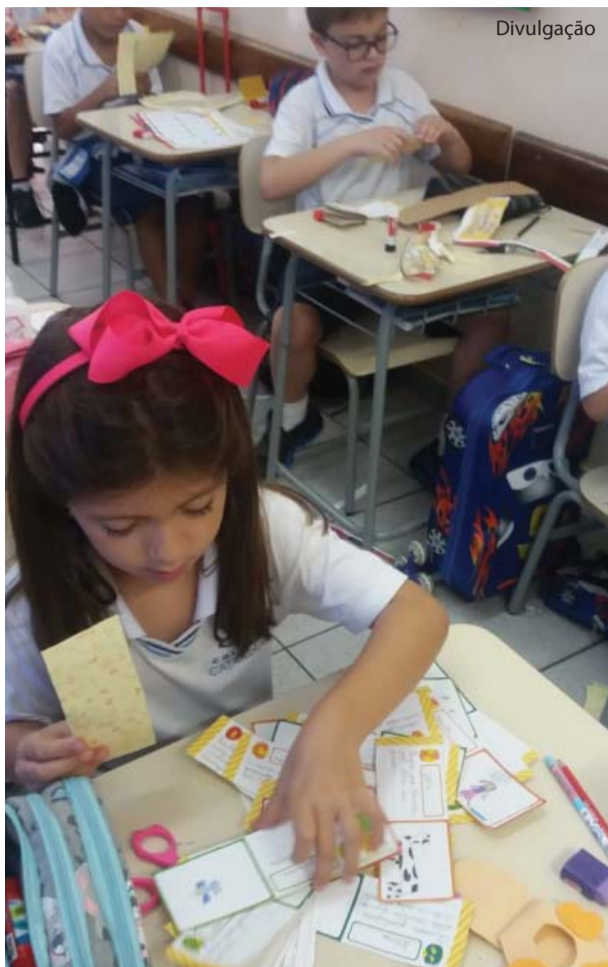
Alunos trabalharam com o tema "arte".