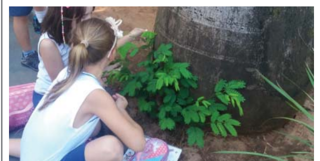
Projeto Pesquisa de Campo.