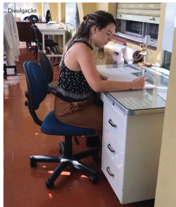
As provas foram aplicadas simultaneamente.

A universidade pública holandesa foi criada em 17 de outubro de 1923 e está situada em Nijmegen, cidade mais antiga do país. A instituição possui sete faculdades e mais de 19.900 estudantes.