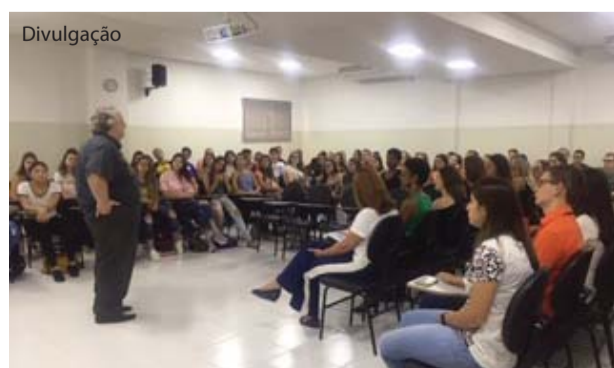
Recepção do curso de Medicina.