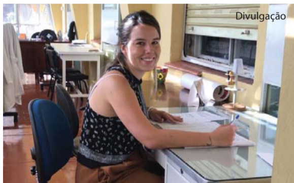
A aluna da universidade holandesa fez suas provas no Laboratório da UNIFIPA.

A UNIFIPA sediou provas de um dos programas de mestrado em Ciências Políticas da Radboud University Nijmegen/Nijmegen School of Management, Holanda. Os exames foram aplicados simultaneamente com a universidade holandesa. Página 08.