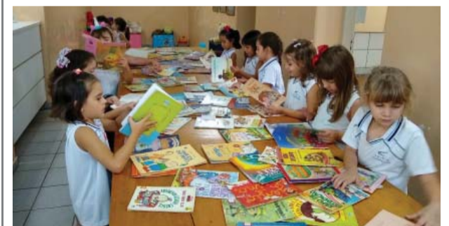
Meu livrinho da biblioteca.