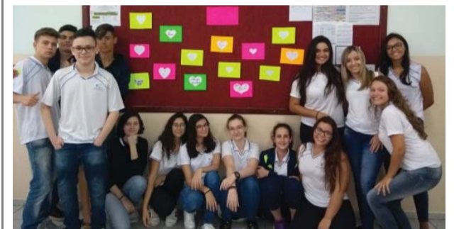
Alunos comemoram o Valentine's Day