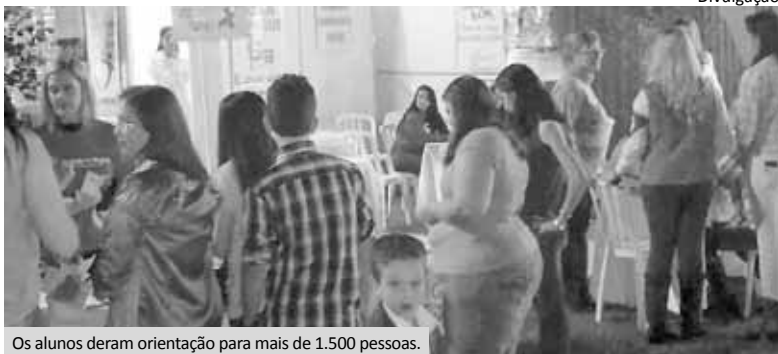
Os alunos deram orientação para mais de 1.500 pessoas.