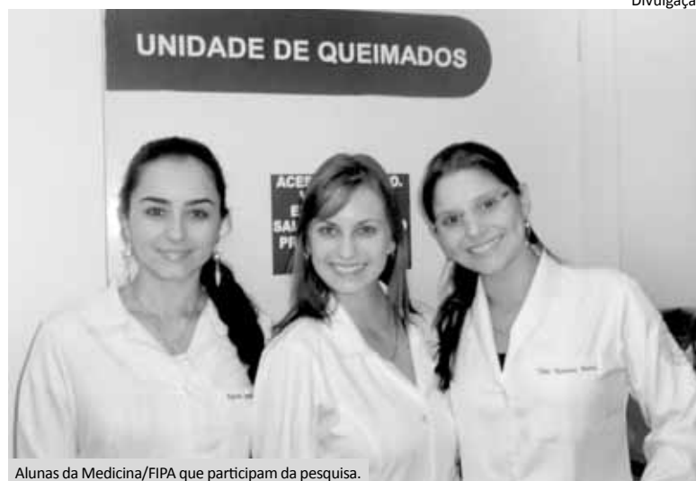
Alunas da Medicina/FIPA que participam da pesquisa.