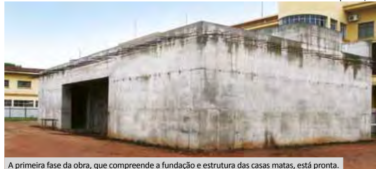
A primeira fase da obra, que compreende a fundação e estrutura das casas matas, está pronta.

Os hospitais da FIPA em números. Página 02.