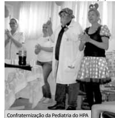
Confraternização da Pediatria do HPA