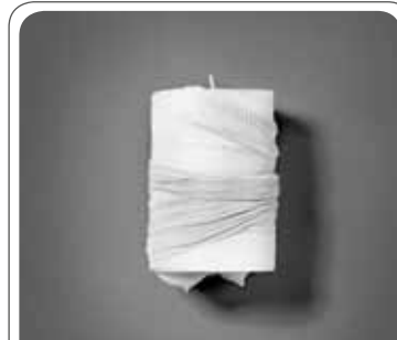
Use uma meia-calça velha para limpar a superfície de velas.