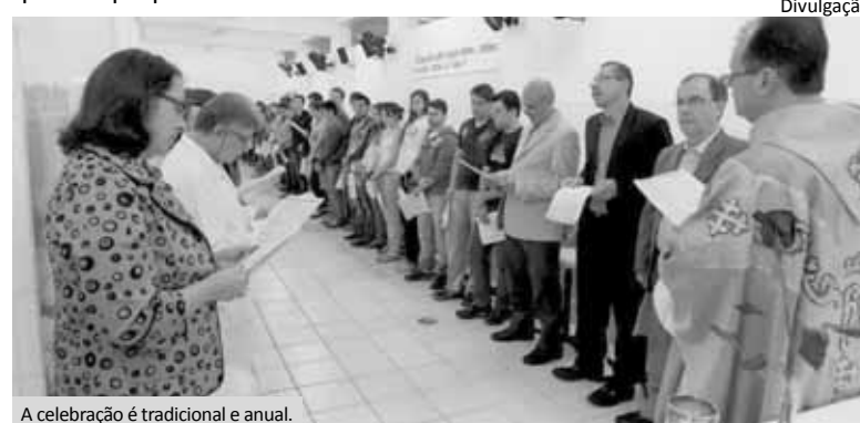
A celebração é tradicional e anual.