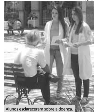
Alunos esclareceram sobre a doença.