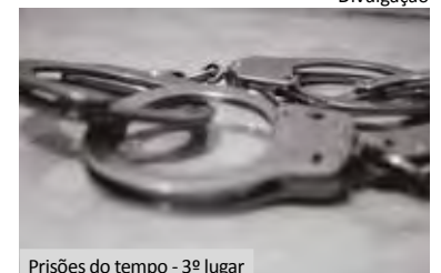
Prisões do tempo - 3º lugar