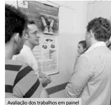
Avaliação dos trabalhos em painel

A premiação dos trabalhos, inclusive do III Concurso de Fotografia, ocorreu no encerramento, dia 26, às 9h00, no Anfiteatro Padre Albino. Os trabalhos premiados estão em http://fipa.com.br/facfipa/cic/2013/Divulgacao