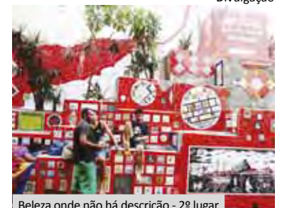
Beleza onde não há descrição - 2º lugar