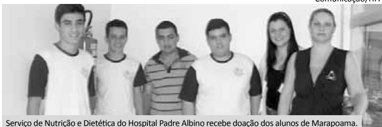
Serviço de Nutrição e Dietética do Hospital Padre Albino recebe doação dos alunos de Marapoama.

Em nome da Diretoria da Fundação Padre Albino, a Administração e o Comitê Gestor dos hospitais agradecem a lembrança e parabenizam a escola pela iniciativa. Comunicação/HPA