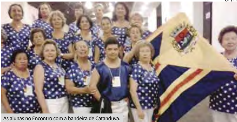
As alunas no Encontro com a bandeira de Catanduva.