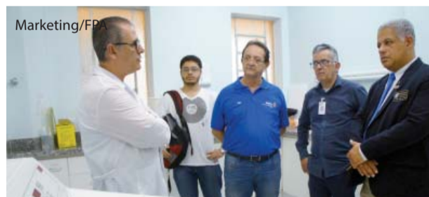
Governador do Rotary em visita a laboratório da UNIFIPA.

Doação Integrantes da Casa da Amizade do Rotary Catanduva Norte doaram aparelho de tevê de 49 polegadas ao Hospital Emílio Carlos no final do mês de setembro, que será disponibilizado aos pacientes que aguardam consultas nos ambulatórios.