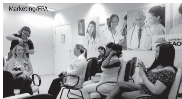
O treinamento visa melhoria na qualidade do atendimento e dos serviços.