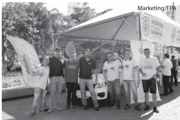
Marketing/FPA Os locutores participantes do evento pró HCC.

Em apenas três horas, das 9h00 às 12h00, o III “Rádio abraça HCC” realizado dia 22 de setembro último, na Praça Monsenhor Albino, arrecadou R$ 11.850,00. Nesse dia, as emissoras de rádios de Catanduva se reuniram e transmitiram a mesma programação para divulgar o trabalho do Hospital de Câncer de Catanduva.