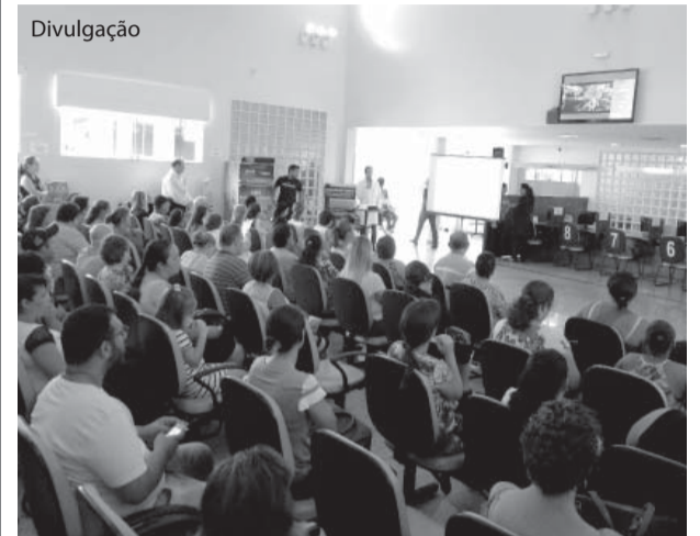
A palestra foi uma das ações do AME no Outubro Rosa.

Além disso, o ambulatório foi decorado com motivos alusivos ao movimento e entregues goma de fruta rosa para as mulheres presentes.