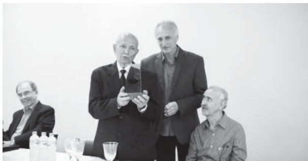
Troféu Monsenhor Albino.

O Troféu Fundação Padre Albino, que tem o objetivo de, em reconhecimento aos méritos de membros da Fundação e seus funcionários, distinguir, exaltar e