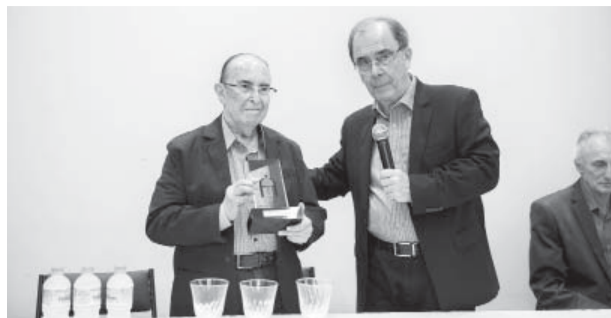
Troféu Fundação Padre Albino.

No dia 21 de setembro, às 20h30, no Anfiteatro Padre Albino, dentro da programação da XXVII Semana Monsenhor Albino, a Fundação promoveu a outorga dos troféus Fundação Padre Albino e Monsenhor Albino.