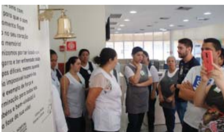
Hospital Emílio Carlos - visita à Radio-terapia