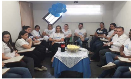
PAS - Cine Pipoca