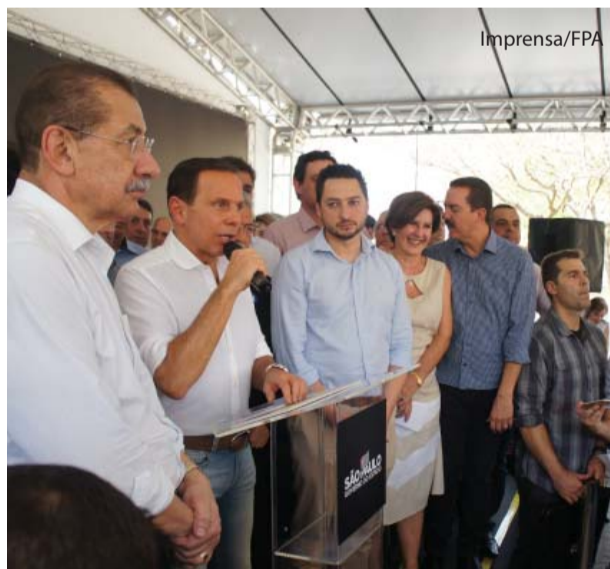
Governador Doria: R$ 2 milhões para o HCC.