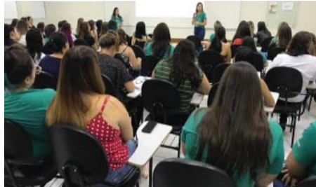
Curso de Enfermagem - VI Simpósio de Curativos