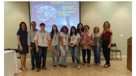
Colégio Catanduva - concurso de música - equipe vencedora