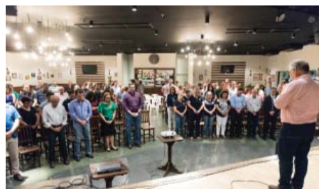
Lançamento da campanha Desafio de Natal 2019