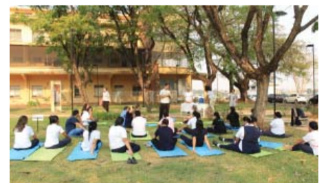
Hospital Emílio Carlos - ginástica laboral para funcionários