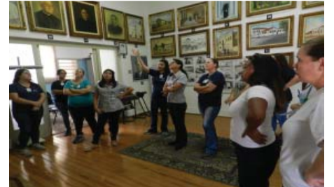
HPA - Visita de funcionários ao Museu Padre Albino