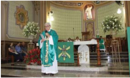
Missa de abertura.