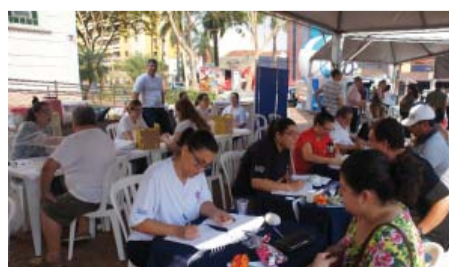
Fundação Padre Albino na Praça