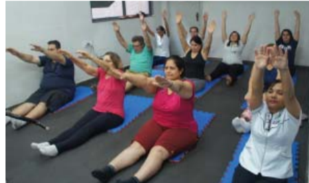
PAS - Relaxamento - Yoga profissional