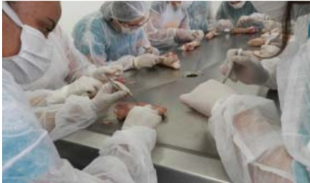
Curso de Enfermagem - V Curso de Desbride