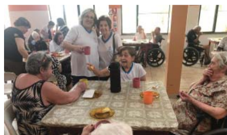
Curso de Ed. Física - café solidário no Recanto