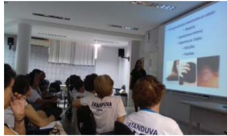
Curso de Farmácia - Palestra para a 3ª Idade