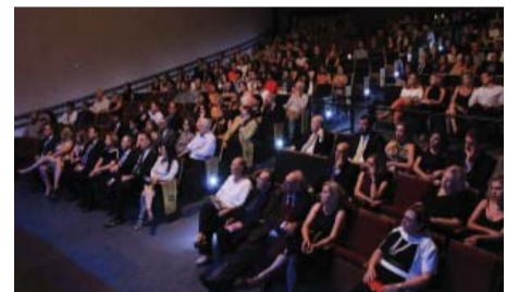
Curso de Medicina - Solenidade dos 50 anos