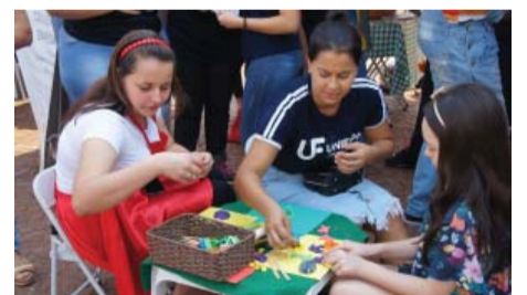
Fundação Padre Albino na Praça