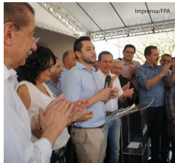
Secretário Marco Vinholi: união de todos para um propósito maior.