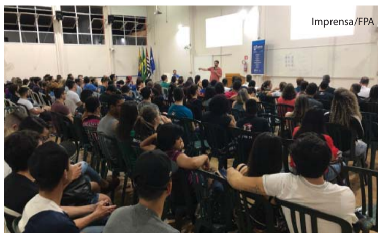
Todas as palestras da Semana tiveram excelente público.