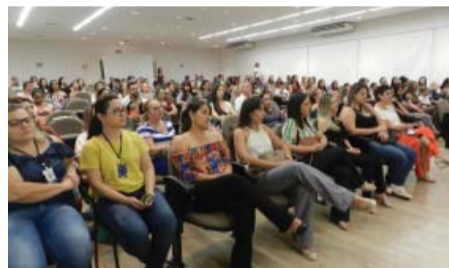
Colégio Catanduva - Concurso de redação