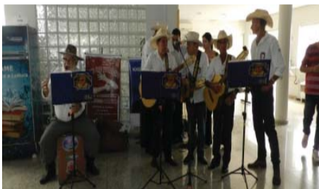
AME - Apresentação da orquestra de viola caipira Novo Mundo.