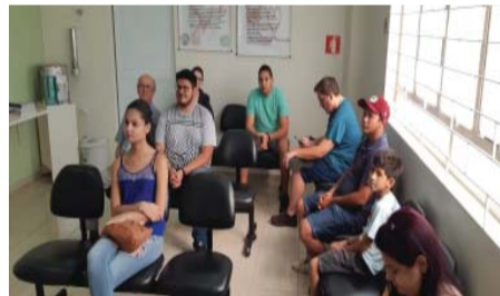
Curso de Administração - Projeto Primavera Vermelha