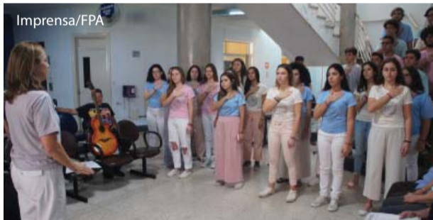
Apresentação no Hospital Emílio Carlos.

No dia 5 de setembro, os corais juvenis Meraki e Quartirão da Música apresentaram-se, respectivamente, no Hospital Emílio Carlos e no Serviço de Radioterapia. As apresentações estavam na programação do FESCC (Festival de Corais de Catanduva), o maior do interior de São Paulo, realizado em Catanduva de 4 a 7 de setembro, com profissionais de todo o Brasil.