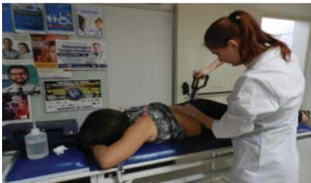
Curso de Biomedicina - Auriculoterapia e vacuoterapia