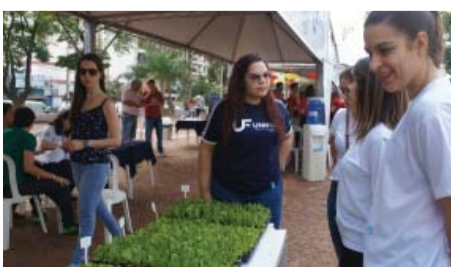
Fundação Padre Albino na Praça