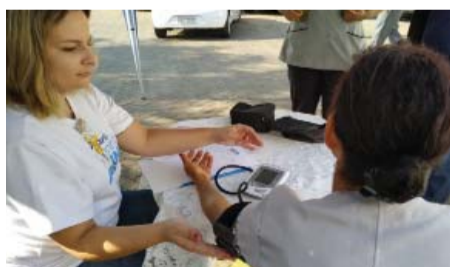
PAS - Promovendo a saúde