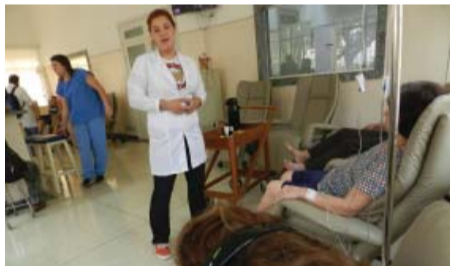
Curso de Biomedicina - Café na manhã na Quimioterapia