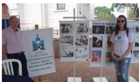
Fundação Padre Albino na Praça