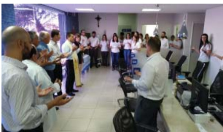
PAS - Bênção na abertura da Semana