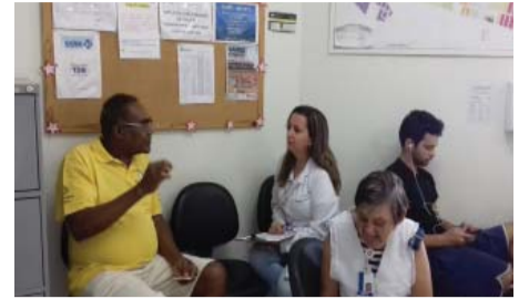
Curso de Farmácia - Palestra na UBS do Solo Sagrado