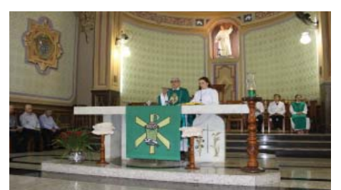
Missa de encerramento