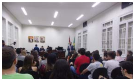
Curso de Direito - 1ª Olimpíada Jurídica