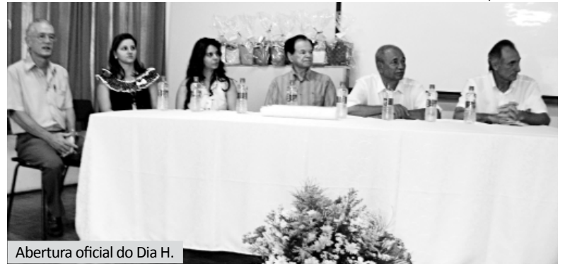
Abertura oficial do Dia H.