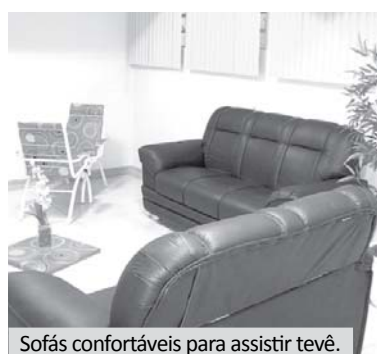
Sofás confortáveis para assistir tevê.