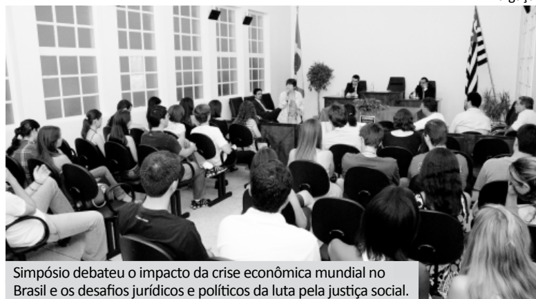
Simpósio debateu o impacto da crise econômica mundial no Brasil e os desafios jurídicos e políticos da luta pela justiça social.

“O Curso de Direito das Faculdades Integradas Padre Albino, desde a sua implantação, no ano de 2003, tem a tradição de encerrar suas atividades letivas com o Simpósio