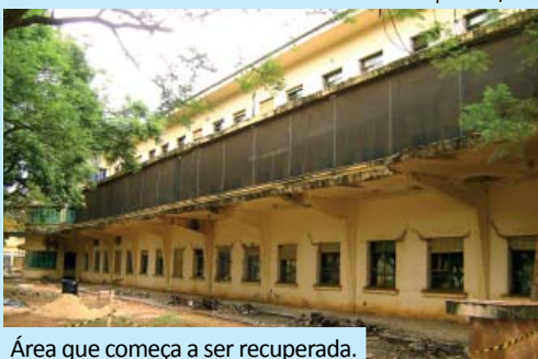
Área que começa a ser recuperada.