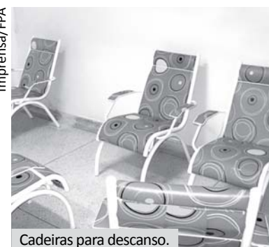
Cadeiras para descanso.