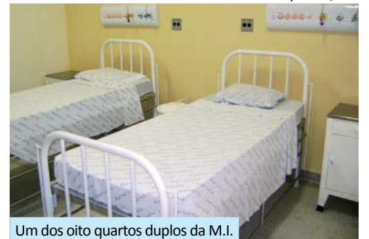
Um dos oito quartos duplos da M.I.