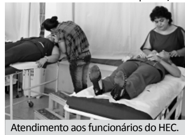
Atendimento aos funcionários do HEC.