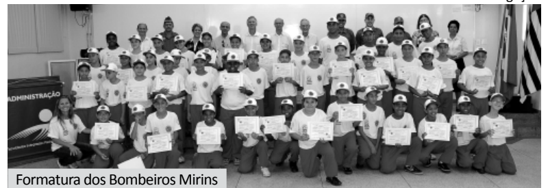
Formatura dos Bombeiros Mirins