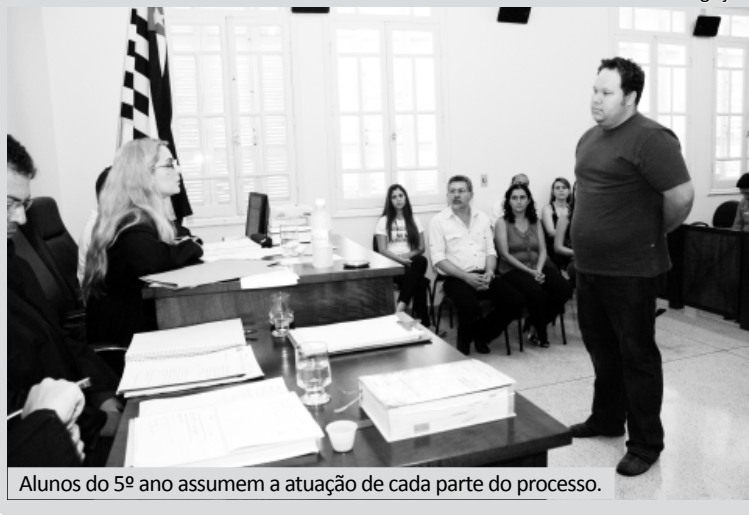
Alunos do 5º ano assumem a atuação de cada parte do processo.