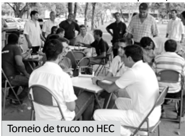
Torneio de truco no HEC