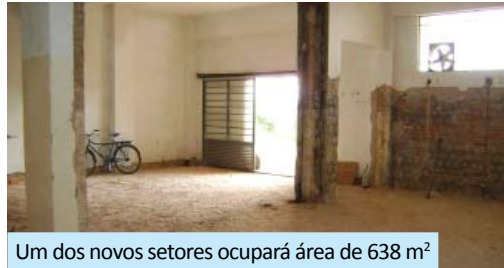
Um dos novos setores ocupará área de 638 m 2