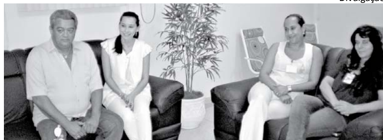
Presidente do Sindicato da Saúde, na sala com funcionárias, prestigia a inauguração.