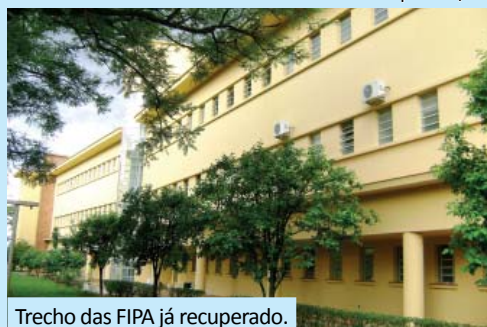
Trecho das FIPA já recuperado.