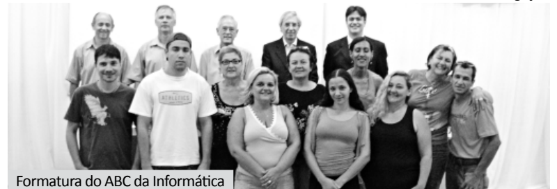
Formatura do ABC da Informática