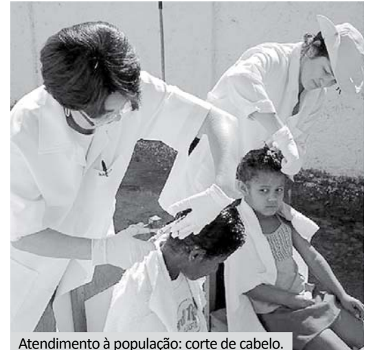
Atendimento à população: corte de cabelo.

da cidade, assim como atenderam nas casas quem não podia se deslocar, e realizaram atividades educativas, abordando temas como saúde da mulher, cuidados com a água, DST/AIDS, parasitose, saúde bucal, auto-exame de mama e prevenção de câncer ginecológico. No total a equipe fez aproximadamente 520 atendimentos.