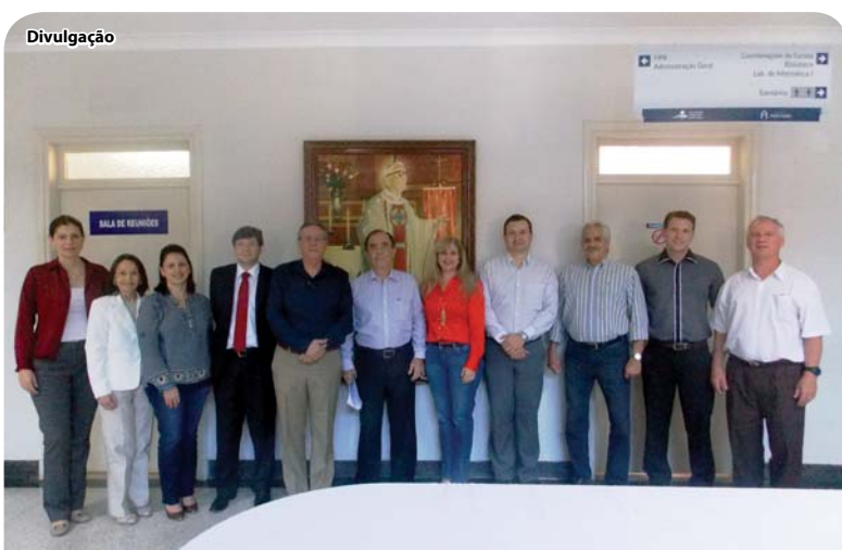
Os gestores da FIPA após a posse.