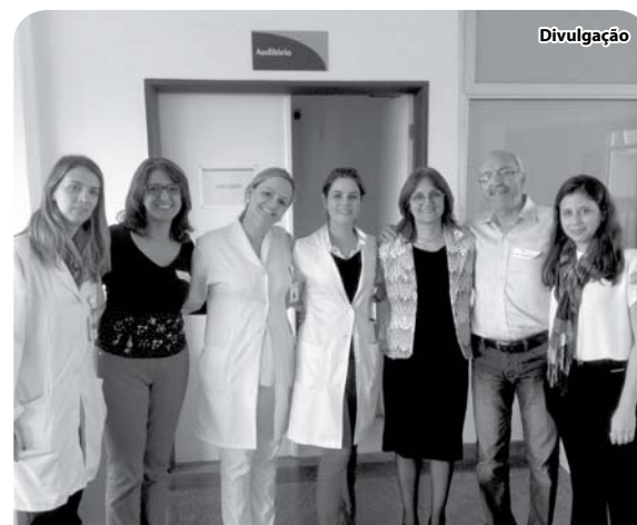
Equipe do HPA realiza visita técnica em unidade de referência.

O churrasco está sendo organizado por uma Comissão, com apoio da Prefeitura e Câmara municipais.