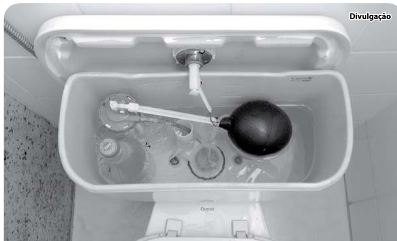
A colocação da garrafa com água gera economia de um litro a cada descarga.

O AME Catanduva está situado na Rua Cascata, 825, Parque Iracema, em Catanduva/SP, fone (17) 3311-1100.