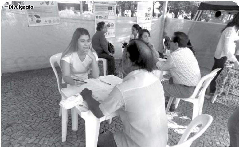
A população foi orientada e fez exames gratuitos.