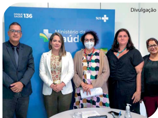
Os diretores com as técnicas do Ministério da Saúde.

Diretores da Fundação Padre Albino foram recebidos no Ministério da Saúde, em Brasília, dia 12 de abril último. Eles agradeceram pela habilitação do Serviço de Radioterapia, relataram a real e grave situação do Serviço de Cardiologia Intervencionista (angioplastia) do Hospital Padre Albino e falaram sobre os constantes valores acima do contratado com o SUS do Serviço de Oncologia, solicitando adequação na Portaria. Última página.