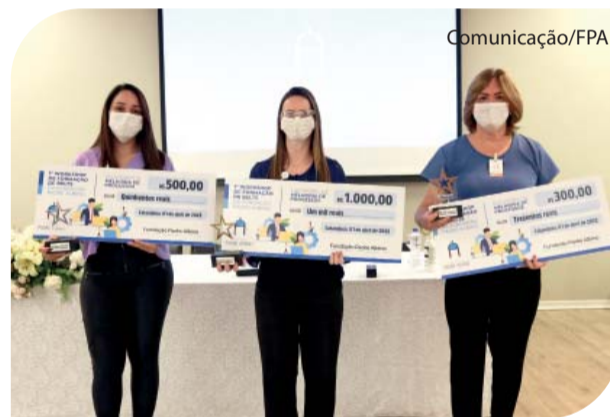
Os três trabalhos premiados.

A Fundação Padre Albino realizou o 1º Workshop de Formação de Belts dia 1º de abril no Anfiteatro Padre Albino. Entre os 10 trabalhos apresentados foram premiadas as experiências exitosas na redução de custos nos subestoques dos setores hospitalares; a redução de desperdício de lençóis e redução de medicação desnecessária em idosos institucionalizados. A votação foi feita pelo público presente e comissão julgadora. Página 7.