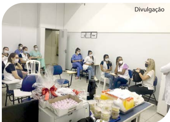
Avaliação nutricional, um dos temas da Semana.