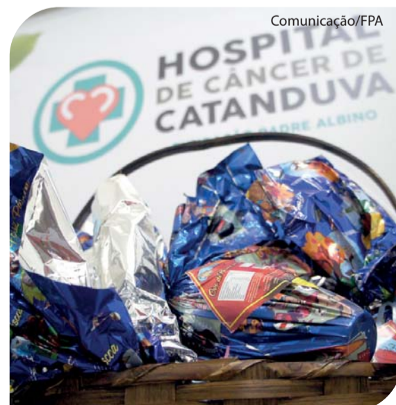
O Supermercado Acapulco é parceiro do HCC desde 2018.

No dia 11 de abril, os pacientes da Quimioterapia e Radioterapia receberam os chocolates das mãos dos colaboradores da Captação de Recursos da Fundação Padre Albino. A entrega ocorreu ao longo da semana para atender todos os pacientes em tratamento.