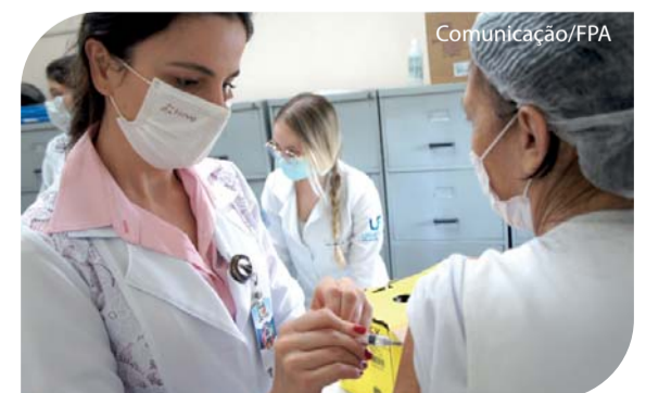
A vacina imuniza contra 3 tipos de gripe.

A vacina foi aplicada pelo Setor de Medicina do Trabalho, com auxílio dos alunos do curso de Enfermagem da UNIFIPA.