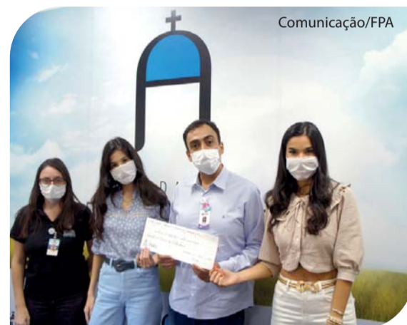
Esta é a 5ª campanha que a Piuka realiza para o HCC.

A Piuka é uma marca de acessórios, com lojas físicas e e-commerce, que cria moda e tendências desde 2007. Conheça: https://www.piuka.com.br/