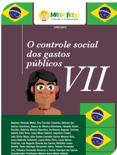
Indígenas e a Amazônia são tema da 7ª cartilha.

O cacique Raoni, em 2020, foi indicado ao prêmio Nobel da Paz por defender o direito dos indígenas, a preservação da Amazônia e, sobretudo, por denunciar a ocupação ilegal das terras indígenas. A luta indígena pela manutenção