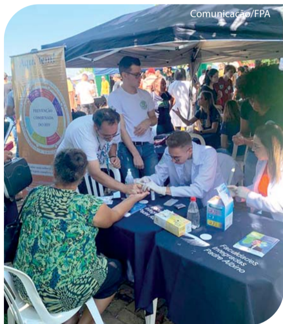
A Unifipa participou com 6 cursos.

No dia 3 de abril foi realizado o 11º Encontro de Veículos Antigos de Catanduva, na Avenida Mogi das Cruzes, ao lado do Aeroporto. A