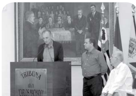
Representantes da Fundação na Câmara Municipal.