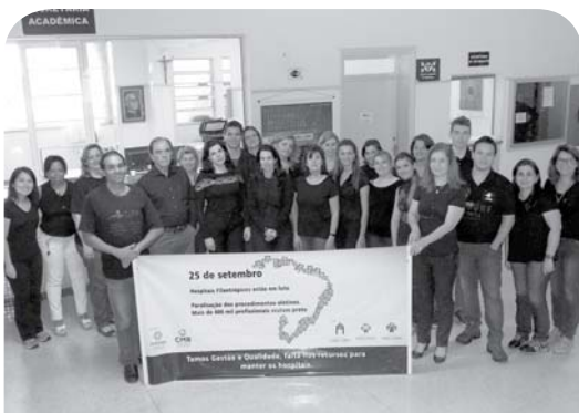
FIPA apóia o movimento.

O movimento de protesto contra o subfinanciamento do Sistema Único de Saúde/SUS foi realizado sem prejuízos para os pacientes. O contratempo passageiro serviu para a busca de uma solução definitiva. A instituição manteve todos os atendimentos de urgência e emergência e os exames para que a população não sofresse desassistência.