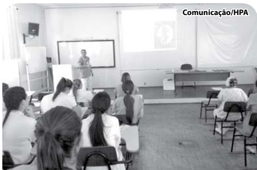
Palestras sobre o tema foram ministradas nos hospitais

pitais Emílio Carlos e Padre Albino, com distribuição de folhetos informativos.