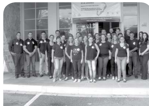
Funcionários da Coordenadoria Geral.