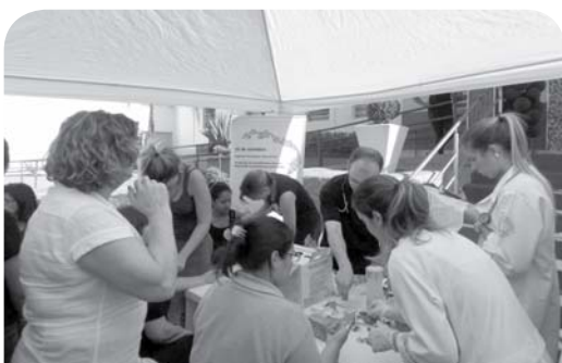
Evento de prevenção em saúde.