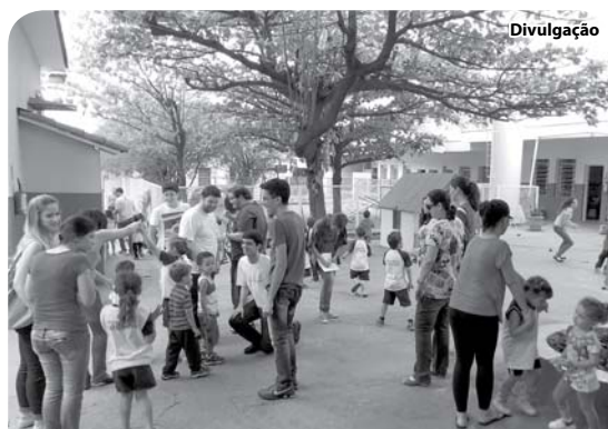
Os alunos desenvolveram atividades lúdicas com as crianças atendidas pela Casa da Criança.

As pessoas que quiserem colaborar com a Casa da Criança podem contribuir mensalmente. Os interessados devem entrar em contato através do telefone (17) 3522-3370, na Rua Pará, 959.