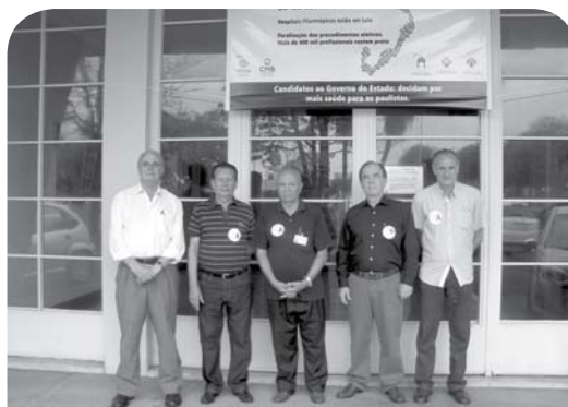
Conselheiros da Fundação.