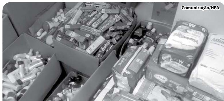
Os produtos arrecadados foram doados para o Recanto Monsenhor Albino e pacientes do SUS.

Durante a XXIII Semana Monsenhor Albino, de 15 a 20 de setembro, os colaboradores dos hospitais Emílio Carlos e Padre Albino realizaram gincana solidária com o objetivo de arrecadar produtos de higiene pessoal para o Recanto Monsenhor Albino e para os clientes internados pelo Sistema Único de Saúde/SUS naqueles hospitais.