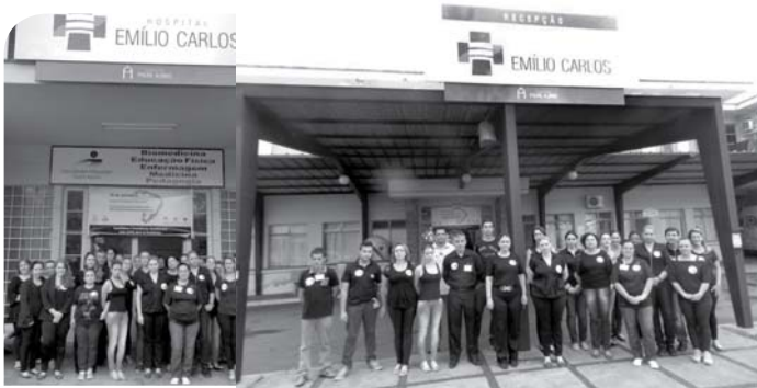
Funcionários do Hospital Emílio Carlos.