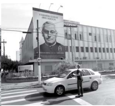
Funcionária entrega folheto sobre o movimento.