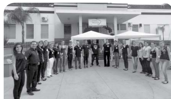
Colaboradores da FPA e internos do curso de Medicina das FIPA.