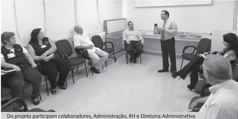
Do projeto participam colaboradores, Administração, RH e Diretoria Administrativa.

Com o objetivo de debater propostas de melhoria, o Hospital Padre Albino lança o projeto Portas Abertas, um novo canal de comunicação entre os colaboradores, a Administração, o Departamento de Recursos Humanos e a Diretoria Administrativa da Fundação Padre Albino.