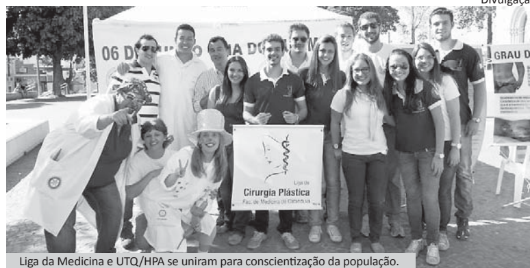
Liga da Medicina e UTQ/HPA se uniram para conscientização da população.