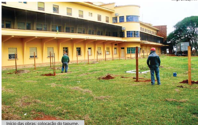
Início das obras: colocação do tapume.