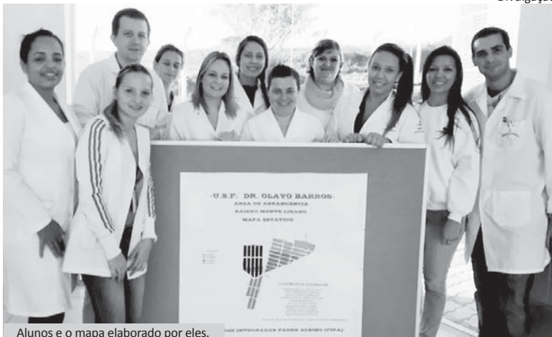
Alunos e o mapa elaborado por eles.