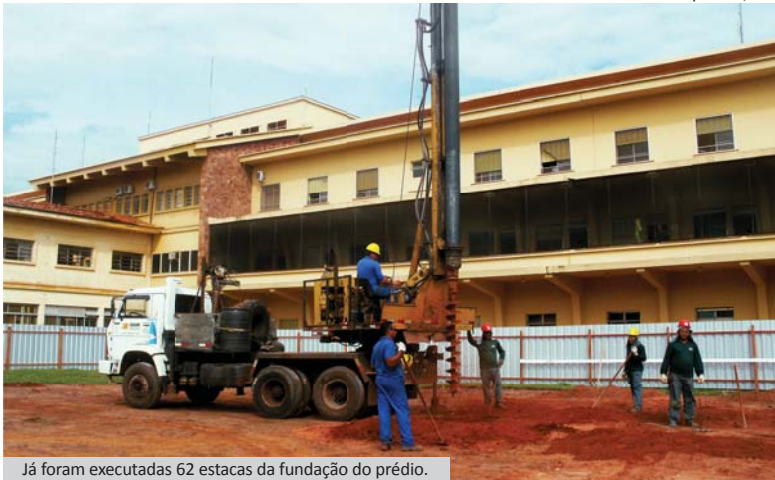
Já foram executadas 62 estacas da fundação do prédio.

A Fundação Padre Albino iniciou no final do mês de maio a construção do seu Serviço de Radioterapia no Hospital Emílio Carlos através da RPA Construtora e Incorporadora Ltda, da cidade de Bebedouro, vencedora da tomada de preços.