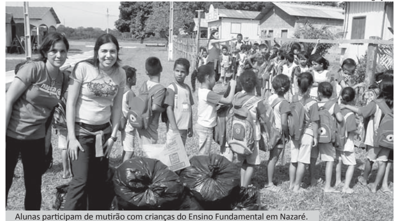
Alunas participam de mutirão com crianças do Ensino Fundamental em Nazaré.