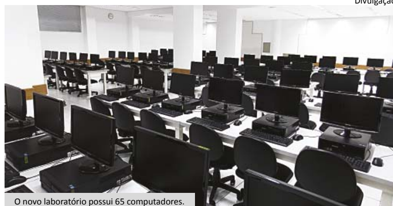
O novo laboratório possui 65 computadores.