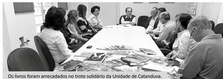
Os livros foram arrecadados no trote solidário da Unidade de Catanduva.