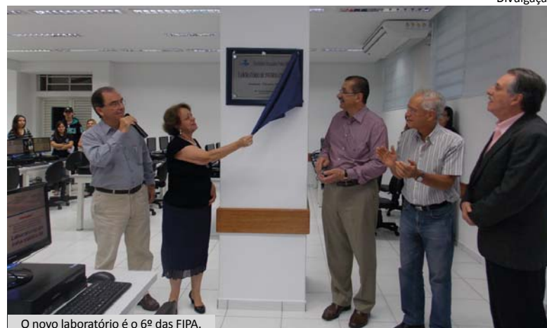
O novo laboratório é o 6º das FIPA.

No novo laboratório, a velocidade da internet foi ampliada de 1 Mb para 10 Mb. De acordo com o setor de tecnologia da informação das FIPA, essa ampliação, além do benefício óbvio, que é uma internet dez vezes mais rápida, traz junto e em curto prazo a melhoria da rede wifi, com expansão da cobertura e aumento da qualidade e velocidade dos pontos