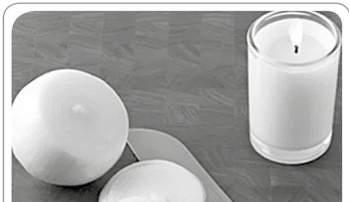
Uma vela acesa pode ajudar você a não chorar ao cortar cebolas.