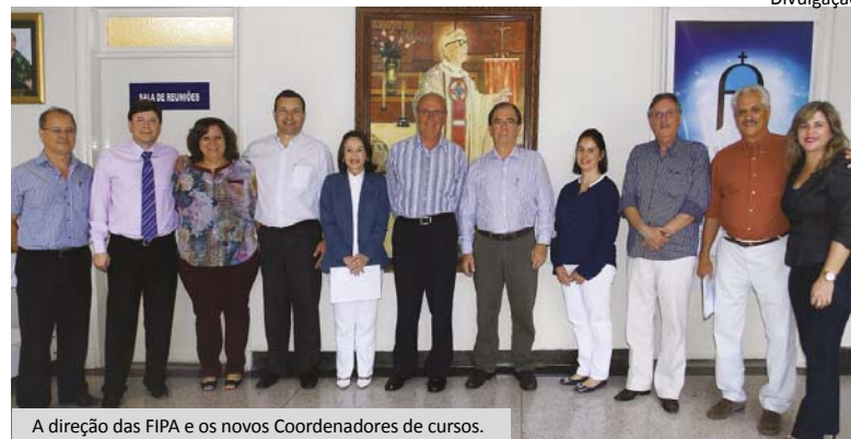
A direção das FIPA e os novos Coordenadores de cursos.