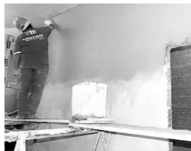
O espaço da cozinha industrial será redistribuído.