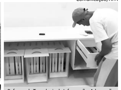
Reforma da Tecnologia da Informação: Adequação do mobiliário