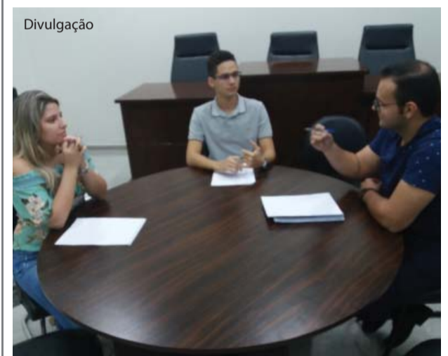
Os alunos realizaram todas as fases do procedimento nas sessões simuladas de mediação.

Direito do Trabalho O curso de Direito em parceria com a OAB de Catanduva e o Instituto dos Advogados Previdenciários - Conselho Federal realizaram o 1º Seminário de Direito do Trabalho, no Campus São Francisco, no dia 25 de outubro. O objetivo do seminário “Biênio de vigência da Reforma Trabalhista: impactos e perspectivas” foi promover a discussão sobre as alterações promovidas na legislação trabalhista com a entrada em vigor da Lei n. 13.467/2017. O seminário teve a participação de 362 pessoas, entre elas graduandos, egressos, docentes do curso de Direito, além de profissionais do Direito.