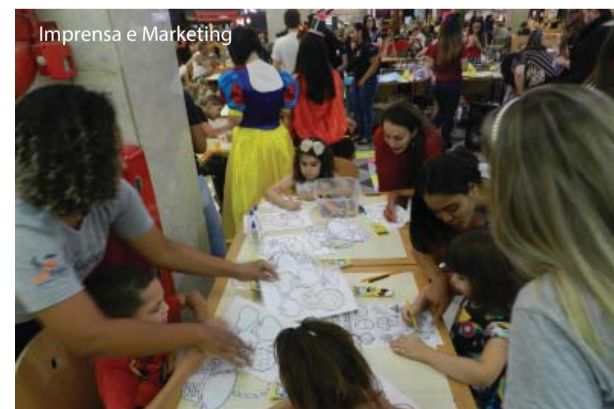
Imprensa e Marketing