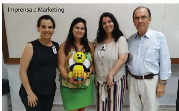
Imprensa e Marketing