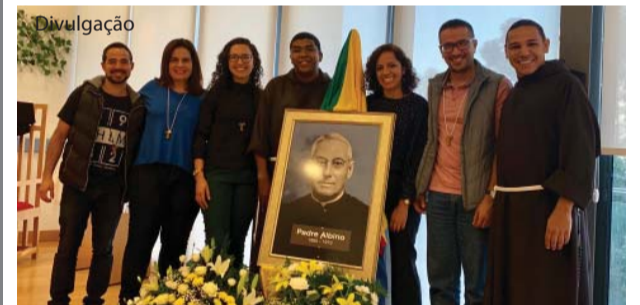
Quadro de Padre Albino ficou em exposição durante toda a Semana.

No dia 21 foi celebrado o Dia de Padre Albino (1882, nascimento; 1912, chegada ao Brasil, e 1973, sepultamento). No dia 22, domingo, foi celebrada missa na aldeia de Codeçoso, em Celorico de Basto, onde nasceu Padre Albino.