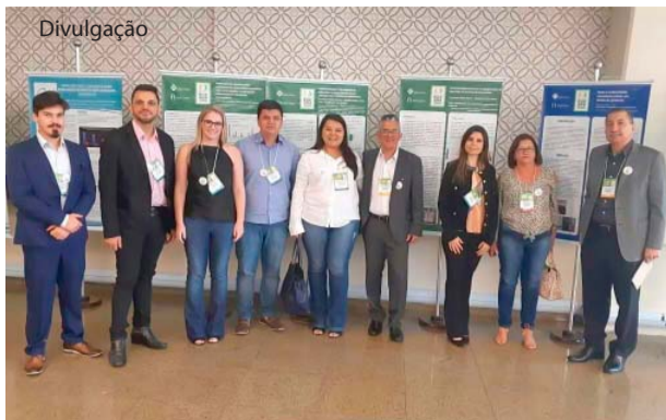
Equipe da FPA com os trabalhos apresentados.

Os hospitais da Fundação Padre Albino, Emílio Carlos (HEC) e Padre Albino (HPA), foram ganhadores das experiências exitosas apresentadas no 2º Fórum Somos SUSTentáveis, promovido pela Fehosp (Federação das Santas Casas e Hospitais Beneficentes do Estado de São Paulo), cuja premiação aconteceu no dia 18 de novembro, no Centro de Convenções Rebouças, em São Paulo.