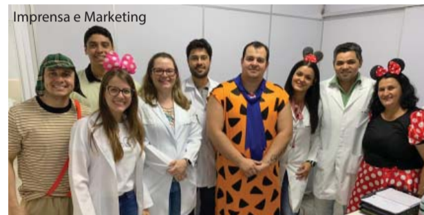
No "Emílio" alguns funcionários fantasiaram-se.

Motorista O Grupo de Apoio ao Trabalhador da Fundação promoveu, nos dias 10 e 11 de outubro, café especial em comemoração ao Dia do Condutor de Ambulância (10 de outubro) como forma de manifestação e respeito ao importante trabalho dos funcionários desse setor.