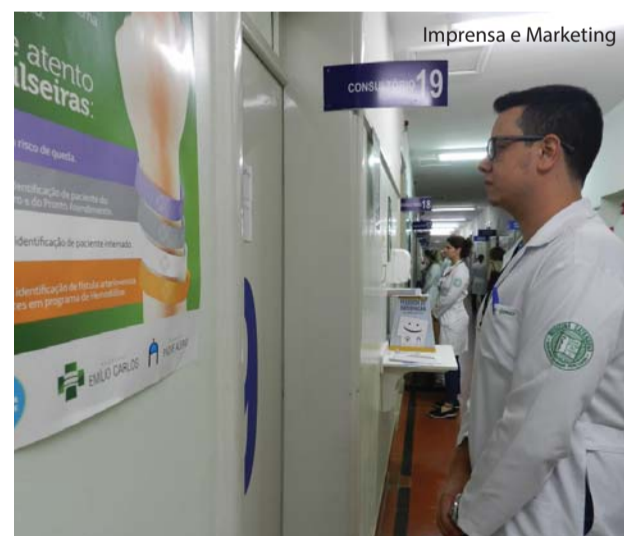
64 alunos fizeram o exame.