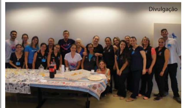
Adimir reuniu os funcionários do AME para agradecer.

Novembro Azul Ministrada pelo urologista Thiago Iorio Tagliari, o AME promoveu a palestra "Prevenção do câncer de próstata", referente ao Novembro Azul. A ação foi voltada para pacientes e colaboradores no dia 4 de novembro.