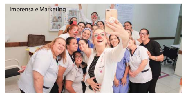
O grupo divulga os benefícios do riso.

A Associação SuperPalhaços iniciou suas atividades em 2015, na cidade de Sorocaba, e promove a prática do voluntariado em hospitais e centros médicos convidando o seu público a conhecer os conceitos e benefícios do riso.