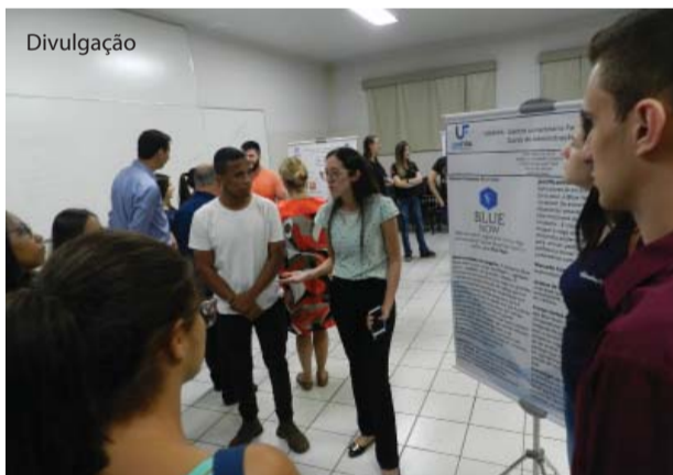
Os alunos apresentaram propostas de negócios em forma de pôster.

No dia 25 de outubro, o curso de Administração da UNIFIPA realizou sua II Feira do Empreendedorismo “Desafios do Empreendedor do Futuro”. Os alunos da 2ª série apresentaram propostas de negócios inova-