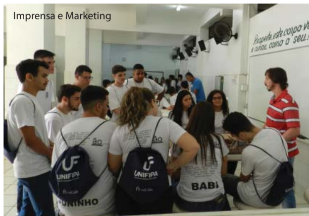
Imprensa e Marketing

Os laboratórios são a grande atração para os alunos.