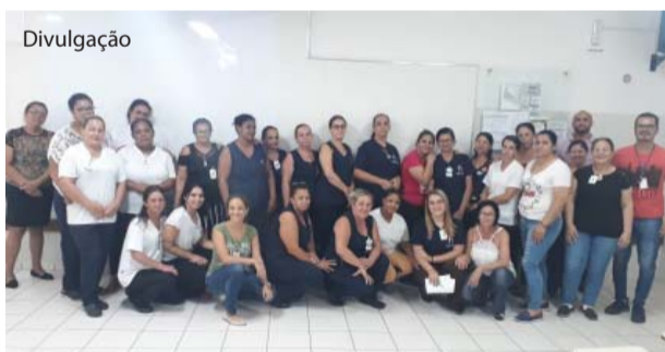
Brigadistas: treinamento e orientações.

As Brigadas da Dengue do Hospital Emílio Carlos e da UNIFIPA participaram de treinamento e reunião de apresentação dos últimos meses de vitórias em que não houve notificação pela Equipe Municipal de Combate ao Aedes Aegypti (EMCAa). Elas também receberam novas orientações para um olhar mais crítico em relação ao ambiente de trabalho para identificar e eliminar possíveis focos de dengue, além de preparação da equipe para o