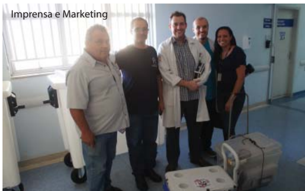
Os órgãos captados seguiram para cidades distintas.

Cinco horas e quinze minutos foi o tempo de duração da cirurgia de captação de múltiplos órgãos realizada no dia 30 de outubro no Hospital Padre Albino. O doador, de 33 anos, teve morte encefálica diagnosticada no dia 29 na UTI do hospital e foram captados coração, pulmões, rins, fígado e córneas. Todos os órgãos foram transplantados com sucesso.