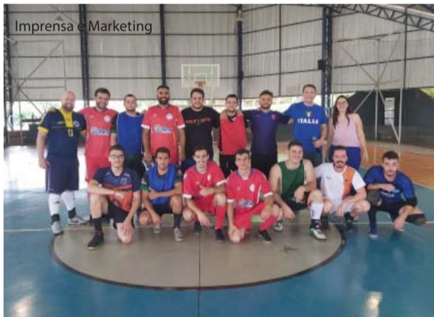
A Comissão de Egressos.

No dia 9 de novembro, o curso de Educação Física Bacharelado da UNIFIPA promoveu a I Copa de Futsal: Egressos Bons de Bola no Complexo Esportivo do Campus Sede. A disputa teve a participação de seis equipes, totalizando 70 participantes entre egressos do Bacharelado e Licenciatura. O primeiro colocado foi o time Real Matismo FC, seguido do Tabajara e Ganhamos Nada, que receberam medalhas e troféu para o time campeão.