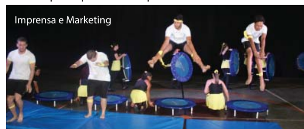
Imprensa e Marketing