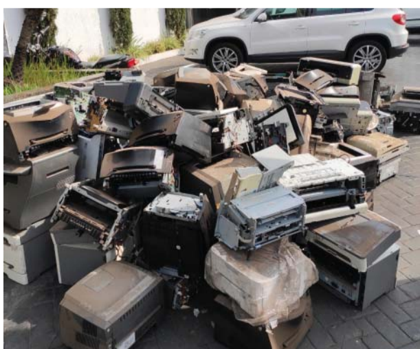
Parte dos equipamentos arrecadados.

O Projeto Tecno Recycle, desenvolvido pela FAECA Júnior, empresa de consultoria do curso de Administração da UNIFIPA, em parceria com a Associação dos Recicladores de Novo Horizonte e Prefeitura Municipal daquela cidade, arrecadou um caminhão de equipamentos - impressoras, computadores, telefones, celulares, aparelhos eletroeletrônicos, entre outros.