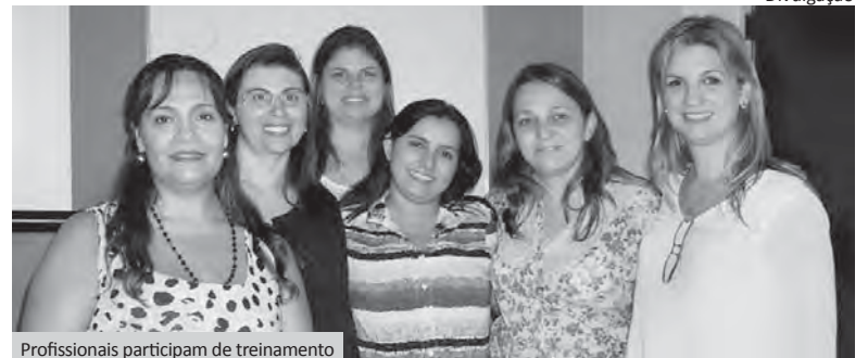
Profissionais participam de treinamento