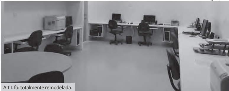
A T.I. foi totalmente remodelada.