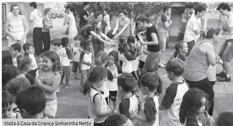
Visita à Casa da Criança Sinharinha Netto