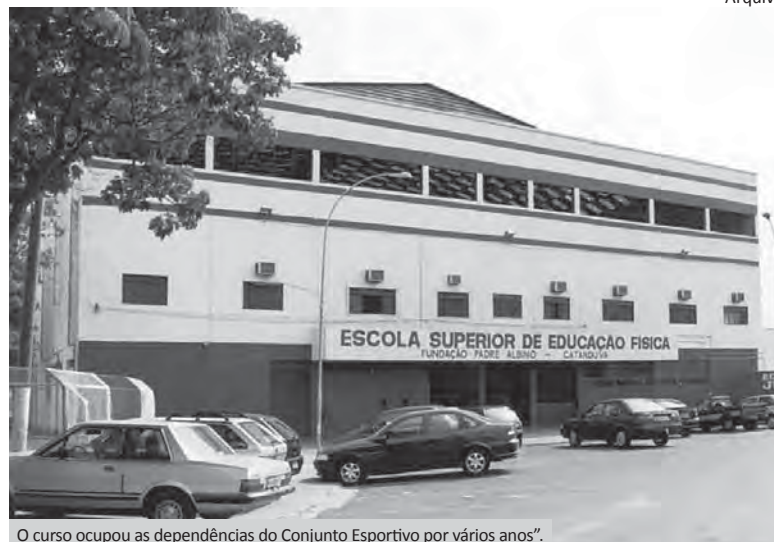
O curso ocupou as dependências do Conjunto Esportivo por vários anos".