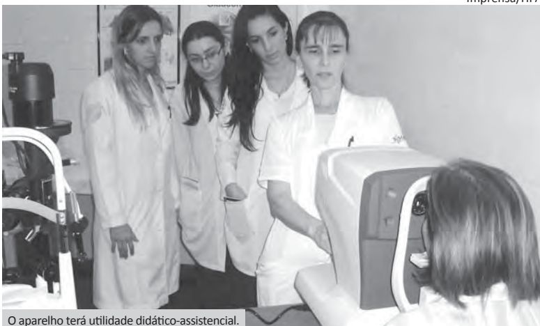
O aparelho terá utilidade didático-assistencial.