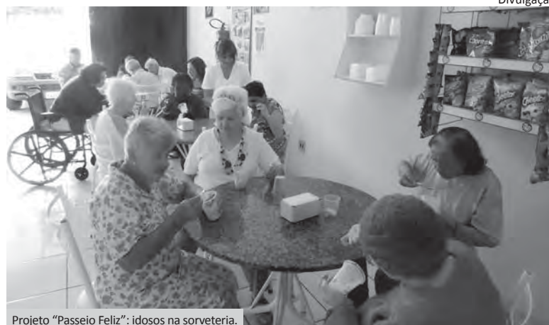
Projeto "Passeio Feliz": idosos na sorveteria.

Em agosto, os idosos foram à Sorveteria Delícias de Verão no dia 21. O passeio faz parte do projeto Passeio Feliz, dos setores de Terapia Ocupacional e Psicologia, que consiste em levar os idosos para integrarem o círculo social da cidade, trabalhar a autoestima e a motivação.