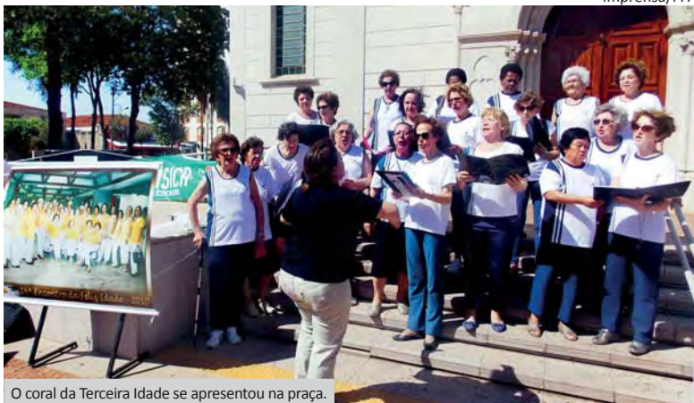
O coral da Terceira Idade se apresentou na praça.