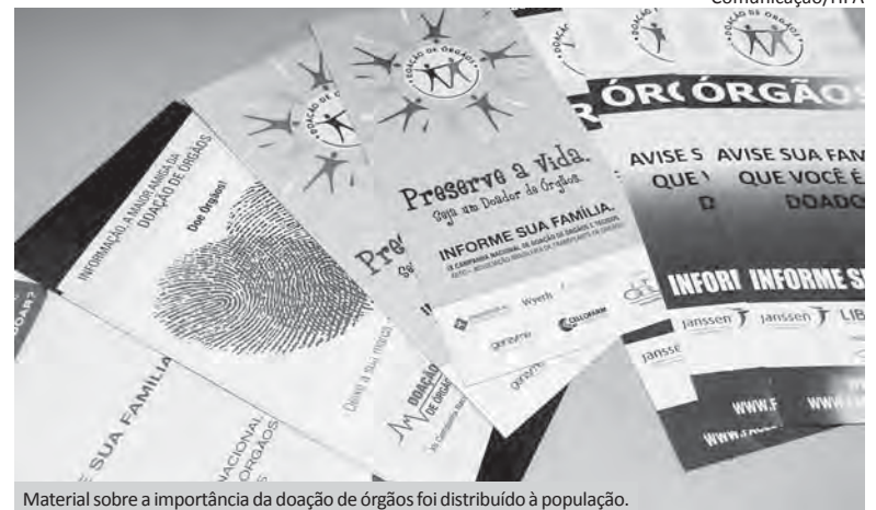
Material sobre a importância da doação de órgãos foi distribuído à população.