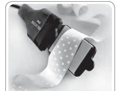
Para desamassar fitas, aproveite sua chapinha.