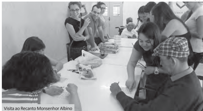
Visita ao Recanto Monsenhor Albino

No início deste ano letivo do curso de Medicina das FIPA, a turma do primeiro ano foi visitar o Museu Padre Albino para conhecer a história do Monsenhor Albino e entender um pouco mais sobre a importância dele para a cidade e para a instituição de ensino na qual estudam. Durante a Semana Monsenhor Albino, realizada de 16 a 21 de setembro último, a intenção foi que os alunos conhecessem outras obras criadas por Padre Albino em Catanduva.