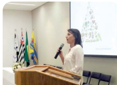
Curso de Pedagogia: palestra "Alimentação saudável".