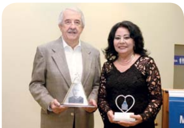
Outorga do Troféu Fundação Padre Albino e Troféu Monsenhor Albino.