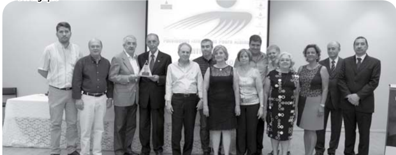
Os membros da AEC presentes.