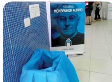
PAS: arrecadação de Alimentos para o Recanto Monsenhor Albino.