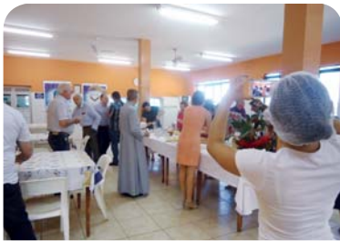
Recanto Monsenhor Albino: chá da tarde para os colaboradores.