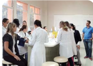
Curso de Biomedicina: exames e orientações para colaboradores da FPA.