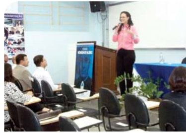
Curso de Administração: palestra "Competências essenciais para a sua carreira. Seja coaching de si mesmo".