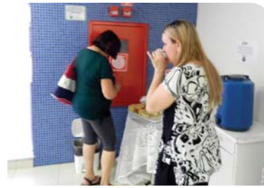
PAS: café especial para funcionários, beneficiários e comunidade.