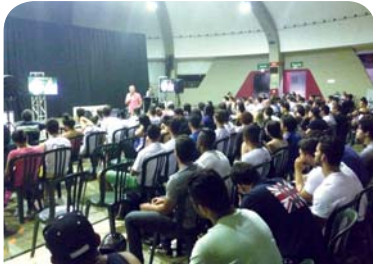
Cursos de Educação Física: palestra "Exercício físico e emagrecimento".