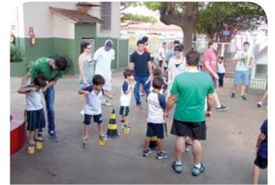
Curso de Medicina: visita à Casa da Criança Sinharinha Netto.