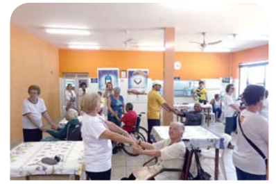
Faculdade da Terceira Idade: café solidário no Recanto Monsenhor Albino.