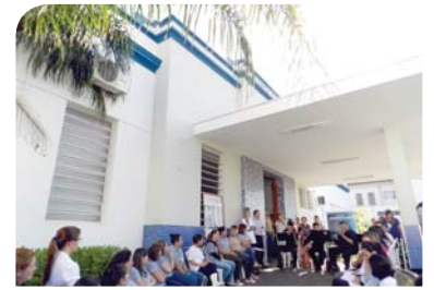
HPA: apresentação do Quarteto de Cordas da OSCA.