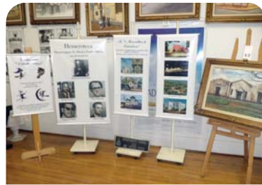
Museu Padre Albino: apresentação de novas peças.