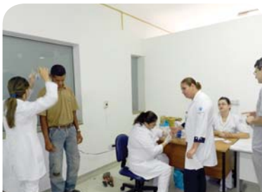
Atividades de prevenção em saúde nos hospitais Padre Albino e Emílio Carlos.