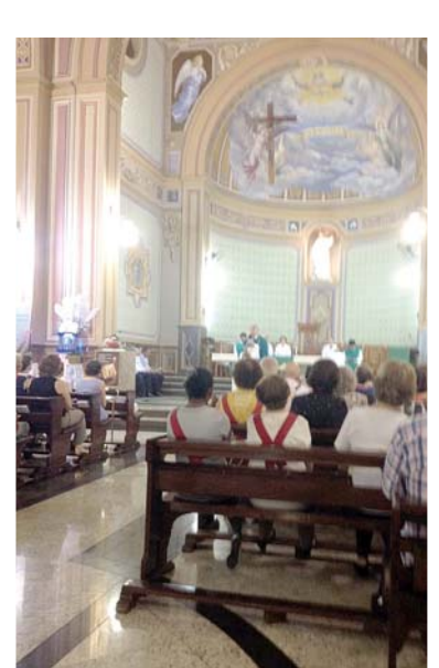
Missa de encerramento da Semana.