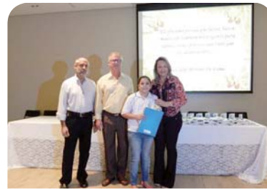
Colégio Catanduva: concurso de redação sobre Padre Albino.