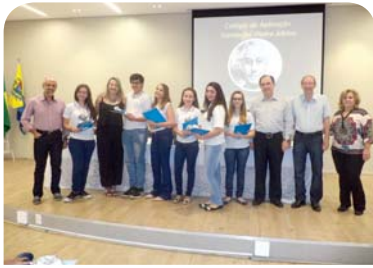
Colégio Catanduva: concurso musical sobre Monsenhor Albino.