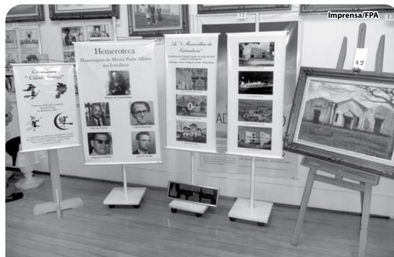
Cinco novas peças foram integradas ao acervo do Museu.

O Museu Padre Albino, na Rua Belém, 647, esquina com Rua Ceará, funciona de 2ª à 6ª feira, das 7h00 às 17h00, e aos sábados, das 7h00 às 11h00. As visitas podem ser agendadas pelo fone (17) 3522.4321. A entrada é franca.