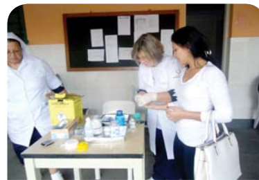
Recanto Monsenhor Albino: verificação de glicemia capilar para os funcionários.