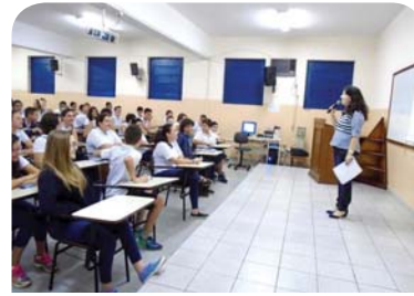
Curso de Biomedicina: orientações no Colégio Catanduva.