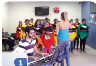
PAS: apresentação do Coral do Instituto dos Cegos.