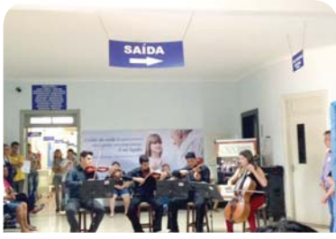
Hospital Emílio Carlos: apresentação do Quarteto de Cordas da OSCA.