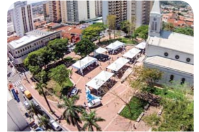
Fundação Padre Albino na praça