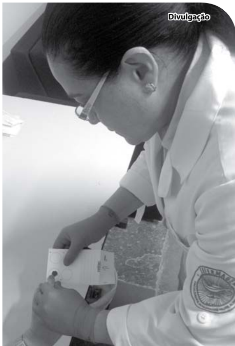
As alunas do curso de Enfermagem fizeram a coleta do material.