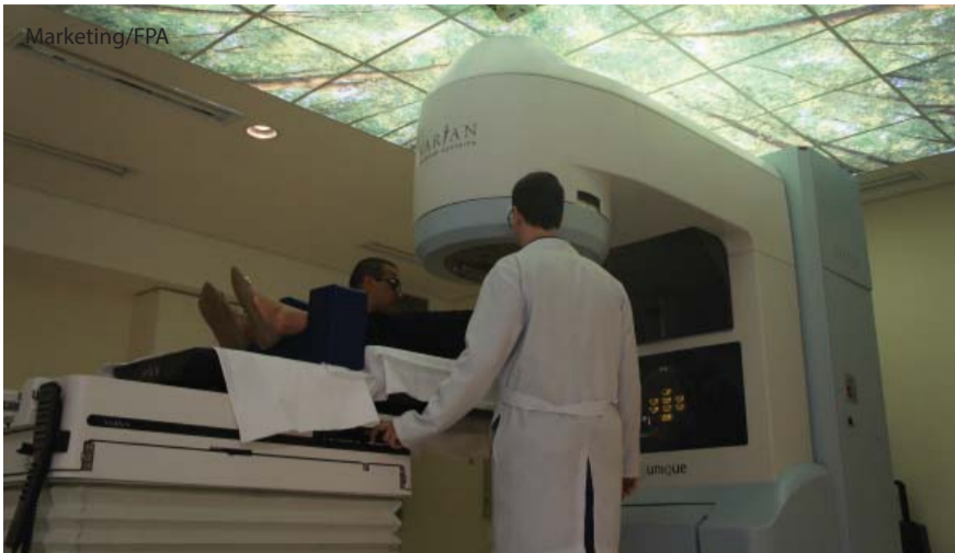
Paciente é posicionado para início do tratamento.

A Fundação Padre Albino anunciou no dia 26 de agosto o início dos atendimentos do Serviço de Radioterapia, que somados aos demais serviços oferecidos à população (consultas, exames, cirurgias, internação e quimioterapia), fecha o ciclo de tratamento e compõe o Hospital de Câncer de Catanduva. A inauguração oficial será no dia 14 de setembro próximo, às 13h00 com a presença do governador João Dória, intermediada pelo secretário de Desenvolvimento Regional, Marco Vinholi.