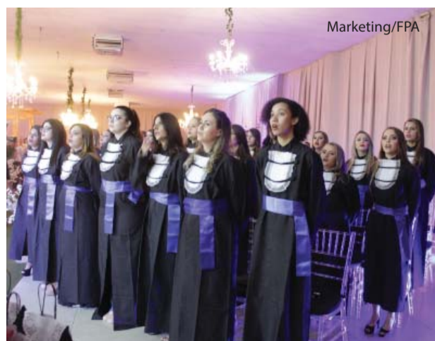
A 5ª Turma da Pedagogia/UNIFIPA

No dia 24 de julho, a UNIFIPA realizou a solenidade de formatura da 5ª turma do curso de Pedagogia no Maison Ge-Vera. Em noite emocionada, a turma com 41 alunas, só formada por mulheres, recebeu o nome de Profa. Esp. Zélia de Oliveira Pantaleão.