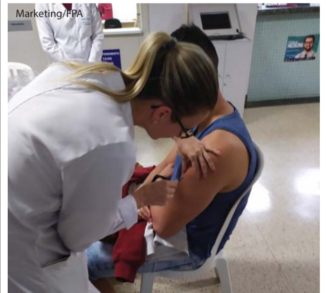
A vacinação foi realizada em parceria com a Secretaria Municipal de Saúde.