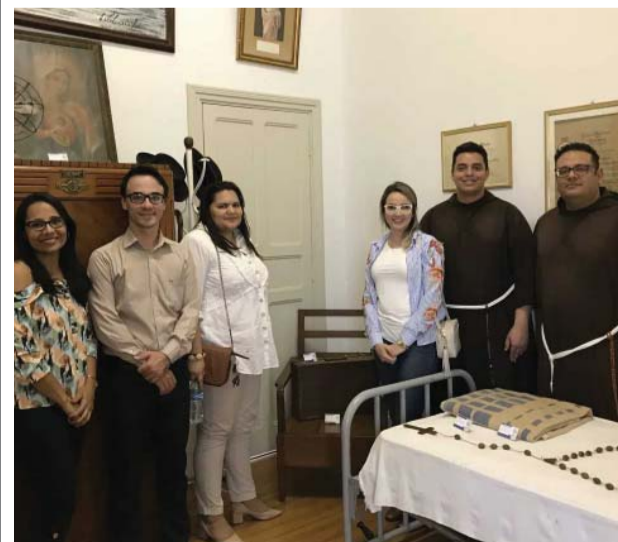
Pe. Albino é tema de treinamento para funcionários em Presidente Prudente.

O Museu Padre Albino, na Rua Belém, 647, é aberto para visitação. Grupos e visitas guiadas devem agendar horário pelo fone 17 3522-4321.