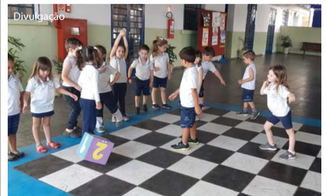
Na atividade foi usado um dado.

De acordo com o número sorteado no dado, as crianças deveriam pular a quantidade de casas correspondentes ao sorteado.