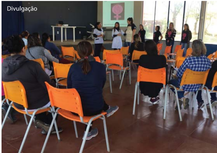
Alunas de Enfermagem realizaram atividades de orientação nos CRAS.

Para celebrar a Semana Mundial do Aleitamento Materno, o curso de Enfermagem da UNIFIPA, o Hospital Padre Albino e a Prefeitura de Catanduva realizaram atividades sobre a importância da amamentação, com a participação de mais de 200 pessoas nos eventos no Centro de Referência de Assistência Social (CRAS) e no III Simpósio de Amamentação. De 14 a 16 de agosto, nos CRAS do Nosso Teto, Bom Pastor, Juca Pedro e Imperial, os alunos do curso de Enfermagem orientaram gestantes e agentes comunitários de saúde quanto à