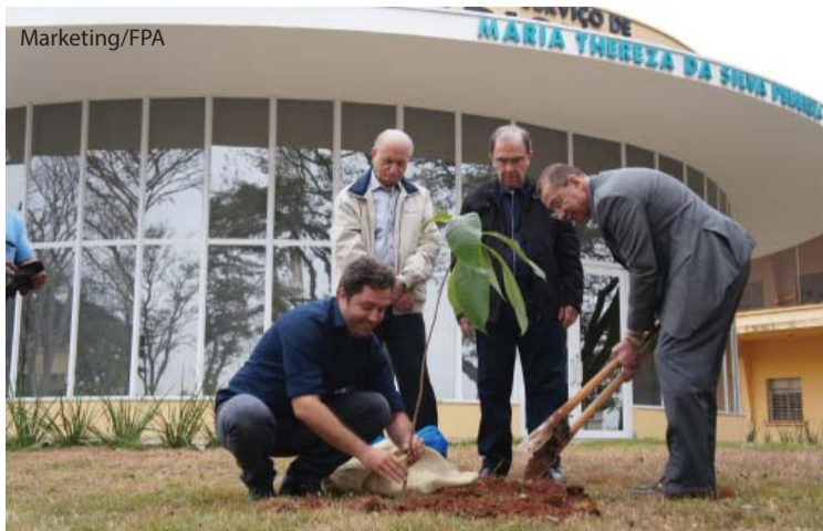
Plantio de muda em homenagem ao Padre Albino diante da Radioterapia.

A Fundação Padre Albino deu sequência, no dia 03 de agosto, às 9h30, no Complexo Esportivo da UNIFIPA, ao projeto "Há cem anos plantando solidariedade", evento desenvolvido em 2018. Foram fixadas placas permanentes nas mudas de ipês plantadas, dando vida à obra "A árvore das lembranças", de Britta Teckentrup, que eterniza as memórias através de árvores. O projeto, parceria entre os cursos de Engenharia Agrônômica e Pedagogia da UNIFIPA, plantou 100 mudas da árvore símbolo de Catanduva no entorno do Hospital Emílio Carlos em memória a entes queridos e em homenagem aos cem anos da chegada de Padre Albino a Catanduva.