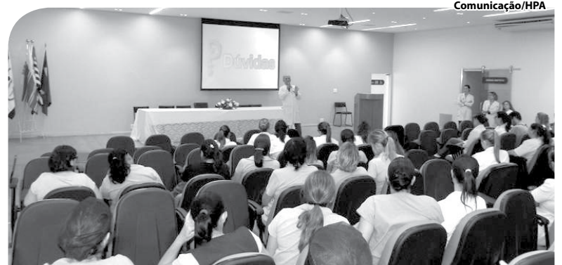
Palestra no Anfiteatro Padre Albino.

Assim como o preconizado pelo Ministério da Saúde e Secretaria da Saúde de São Paulo, os hospitais da Fundação Padre Albino praticam as diretrizes e os dispositivos de humanização e trocam experiências em eventos como o encontro citado para a melhoria contínua do atendimento aos pacientes de Catanduva e região.