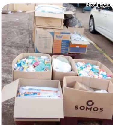
Alunos doaram mais de 34 mil itens.