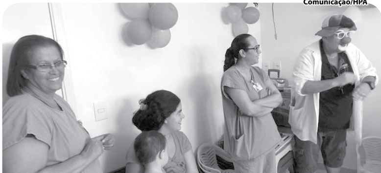
A confraternização teve a participação do projeto "Sara & Cura".