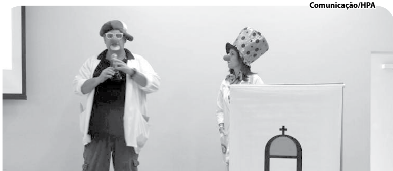
Projeto Dr. Sara & Cura realizou atividades lúdicas com os participantes.

O Emílio Carlos e Padre Albino, assim como o AME Catanduva, possuem Centros Integrados e Grupos de Trabalho de Humanização para o desenvolvimento de atividades e projetos como, por exemplo, o Dia H, entre outras ações e como o Ministério da Saúde e a Secretaria Estadual de Saúde têm o objetivo de transformar o modo de se fazer assistência com humanização.