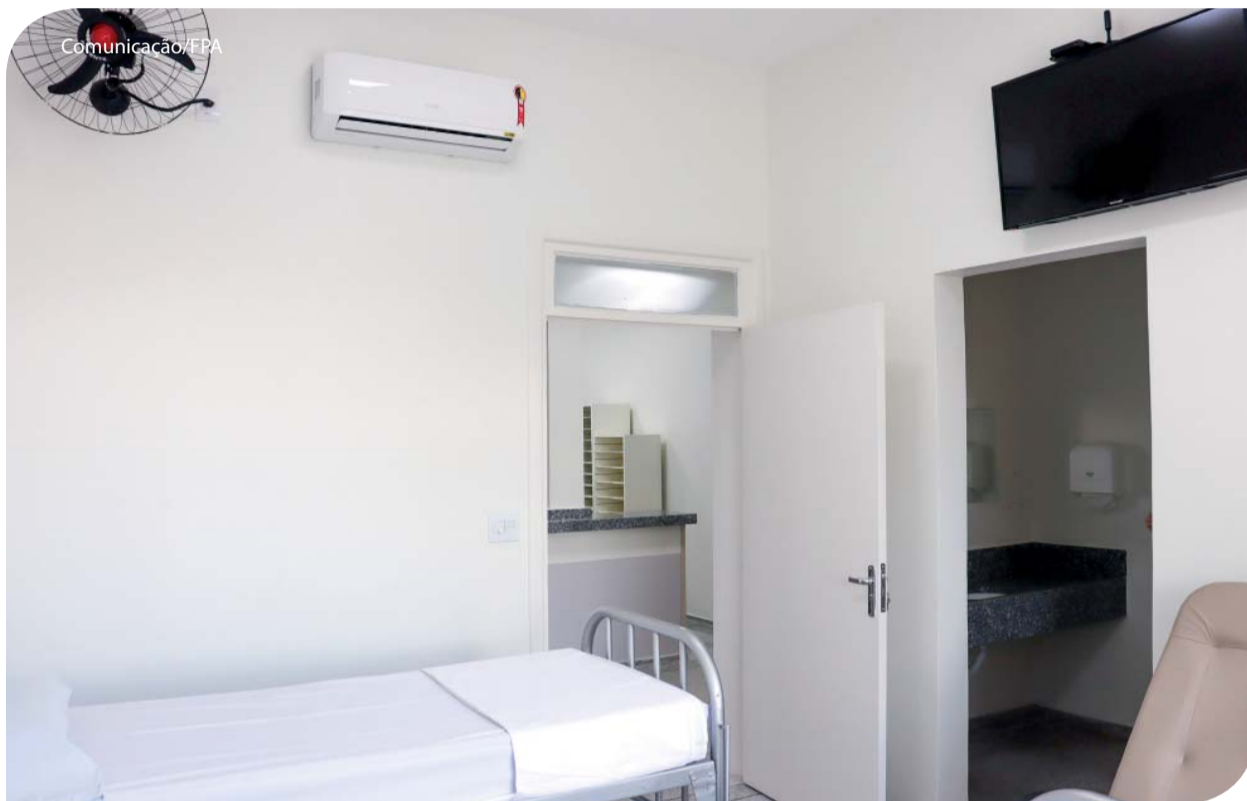
A nova ala prioriza o bem-estar do paciente.

A Fundação Padre Albino (FPA) e a Associação de Assistência ao Hospital Emílio Carlos (AEC) entregaram a nova Ala Amarela de internação para pacientes do SUS no Hospital Emílio Carlos (HEC). Orçada em R$ 1.300.000,00, a reforma contou com apoio de empresas, famílias e pessoas físicas que doaram recursos para sua concretização. A ala foi totalmente revitalizada. Última página.