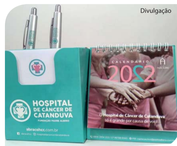
Calendário com suporte para canetas e bloco de papéis.

O Serviço de Radioterapia do HCC ainda não está habilitado pelo Ministério da Saúde.