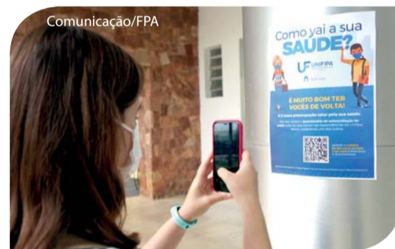
Na volta às aulas a preocupação com a saúde.

Os representantes do NAP ainda orientaram os alunos a respeito das atividades realizadas pelo Núcleo. Vale ressaltar que estão mantidas a obrigatoriedade do uso de máscara durante as aulas e a utilização de álcool em gel. Ao chegar ao campus, o aluno responde a questionário virtual a respeito de sua saúde.