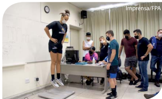
As atletas fizeram duas avaliações de alto rendimento.

No dia 23 de fevereiro, as atletas da equipe de basquete do Bax Catanduva fizeram duas avaliações físicas de alto rendimento no Laboratório de Fisiologia do Exercício do curso de Educação Física da Unifipa.