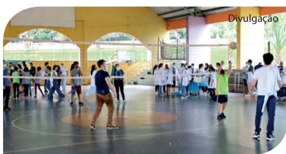
Os alunos da APAE também tiveram atividades esportivas.

No dia 15 de março, na APAE de Catanduva, foi realizada a 12ª edição do “Cromossomos do Amor” para comemorar o Dia Internacional da Síndrome de Down - 21 de março. O evento, realizado pelos cursos de Medicina e Educação Física da UNIFIPA, contou com a presença das Ligas de Genética Médica, Ortopedia e Medicina Esportiva, Endocrinologia,