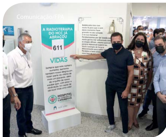
Doria no HCC, que ele inaugurou em 2019.