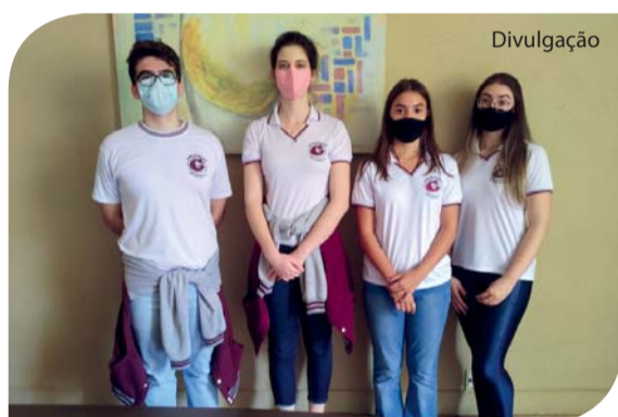
Alunos do Colegião.