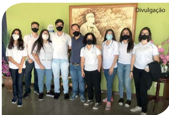
Alunos do Colégio Catanduva.