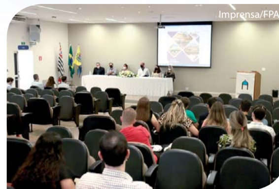
Os novos Residentes foram acolhidos e receberam orientações.

Para acolhimento humanizado, facilitar a adaptação e orientar sobre os valores, procedimentos e rotinas diárias da instituição, os médicos residentes do curso de Medicina/Fameca da Unifipa 2022 foram recebidos no dia 3 de março, das 7h às 12h, no Anfiteatro Padre Albino. A recepção foi organizada pela gerência da Qualidade dos hospitais da Fundação em parceria com a COREME/Comissão de Residência Médica.