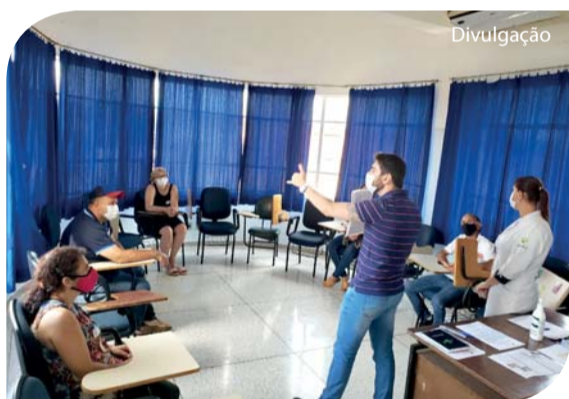
As atividades integram as ações para o Selo Pleno do Hospital Amigo do Idoso.

O Hospital Emílio Carlos (HEC) retomou, no dia 24 de fevereiro, as ações do Selo Hospital Amigo do Idoso com acompanhantes dos pacientes hospitalizados. “As atividades 'Incorporando Redes' e 'Troca de Saberes' são ações exigidas