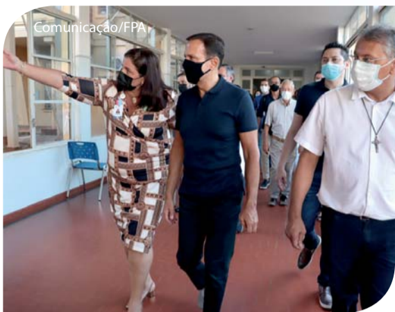
O governador no Hospital Emílio Carlos.

Em sua vinda a Catanduva dia 11 de março, o governador João Doria assinou, no Teatro Municipal Aniz Pachá, os 'autorizos' para construção de novos prédios da Oncologia e do Serviço de Hemodiálise da Fundação Padre Albino.