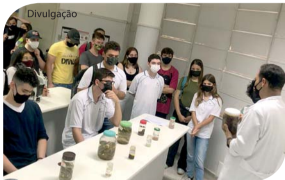
Projeto Descobrimo a diversidade da vida.

Com o objetivo de produzir socialização integrada à cultura corporal do movimento, formando o cidadão que produzirá e transformará seu conhecimento para usufruir do jogo, esporte, atividades