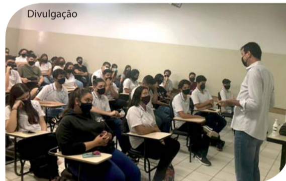
Projeto Educação Financeira.

O projeto levará, aos alunos, os conceitos básicos de finanças, ajudando-os a planejar o futuro de maneira consciente, além de prepará-los para os desafios pessoais e profissionais.