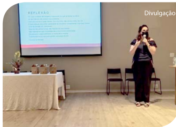
Palestra abordou o tema ser mulher na contemporaneidade.