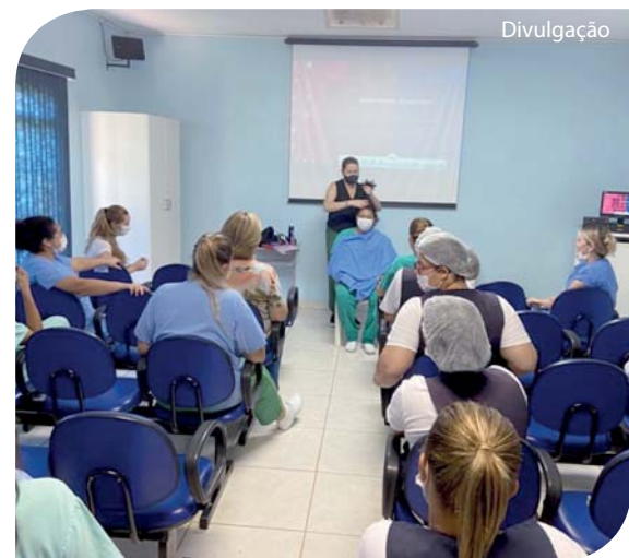
Palestra visou a autoestima e os cuidados pessoais.