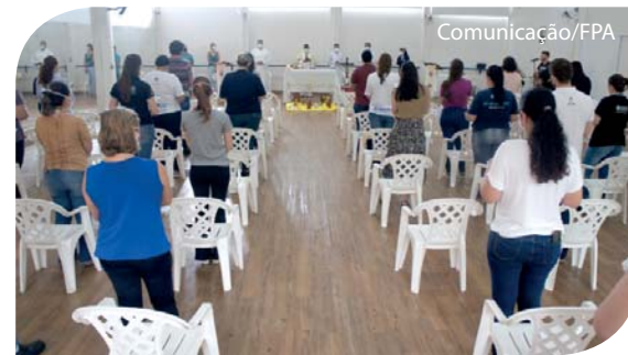
Conselheiros com a equipe gestora da Saúde da Fundação.