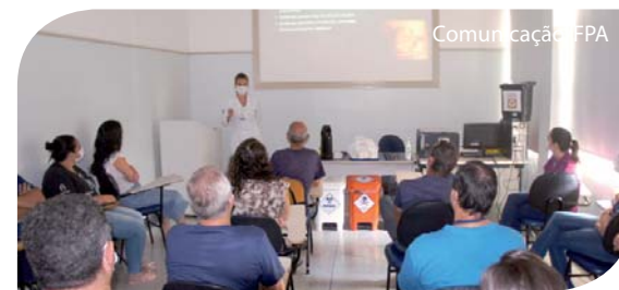
Palestra de conscientização para os colaboradores.

A orientação faz parte das ações de conscientização do Dezembro Laranja, realizadas pela Comissão, para os colaboradores administrativos. Os participantes receberam amostras de protetor solar, um dos principais fatores de proteção da doença, que foram cedidos pela Rede Central.