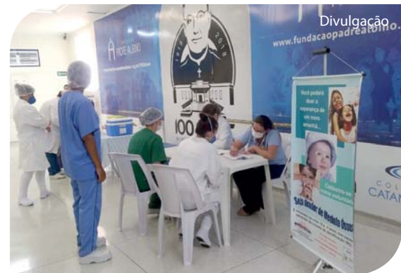
Com a pandemia, as doações foram reduzidas.

A campanha foi organizada pelas Agências Transfusionais, Direção de Saúde e Assistência Social, Gestão do cuidado e Marketing da FPA, em parceria com a equipe de captação e coleta do Hemonúcleo de Catanduva. Informações sobre o cadastro de doadores de medula óssea pelo 17 3522 7722.