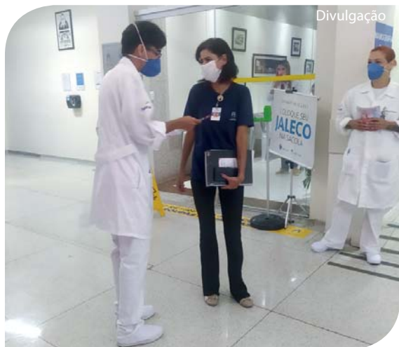
Os colaboradores foram abordados pela equipe.

O Hospital Padre Albino realizou campanha de conscientização de doação de sangue no dia 25 de novembro, alusiva ao Dia Nacional do Doador de Sangue. Participaram da ação colaboradores, pacientes e acompanhantes que foram abordados pela equipe. A conscientização foi organizada pela biomédica responsável pelas Agências Transfusio-