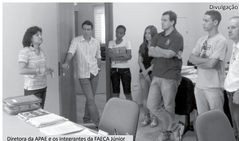
Diretora da APAE e os integrantes da FAECA Júnior