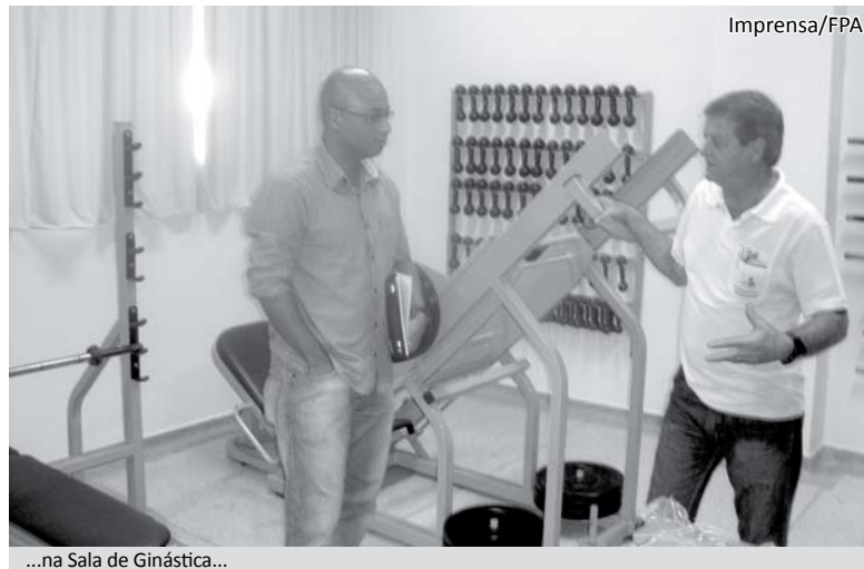
...na Sala de Ginástica...