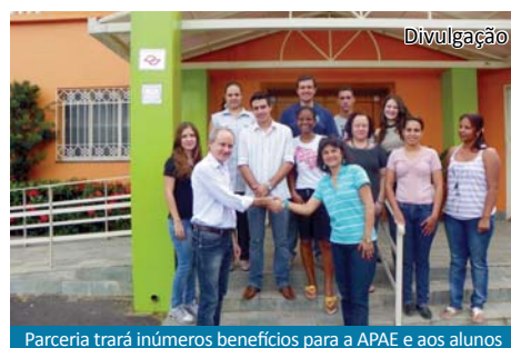
Parceria trará inúmeros benefícios para a APAE e aos alunos

A FAECA Júnior, Empresa Júnior do curso de Administração das Faculdades Integradas Padre Albino, firmou um convênio de parceria para assessorar a APAE de Catanduva para implantação do Programa 5S's. Página 07.