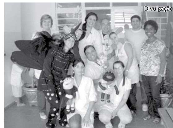
Dengue foi tema de dramatização feita pelos alunos