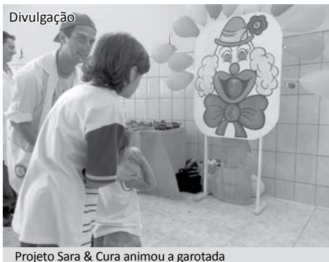
Projeto Sara & Cura animou a garotada