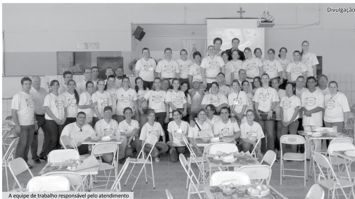
A equipe de trabalho responsável pelo atendimento

Assim como o Ministério, os hospitais da Fundação têm o ob-