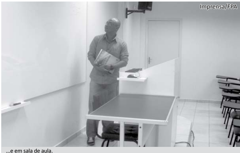
...e em sala de aula.