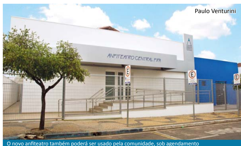
O novo anfiteatro também poderá ser usado pela comunidade, sob agendamento

O curso de Enfermagem das Faculdades Integradas Padre Albino desenvolveu no mês de abril atividades educativas na USF Dr. Alcione Nasorri, no bairro Jardim Eldorado, em Catanduva. As ações focaram a dengue e a conjuntivite. Página 08.