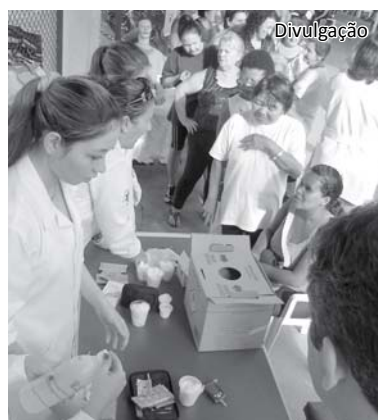
Alunos em atividade no Conjunto Esportivo