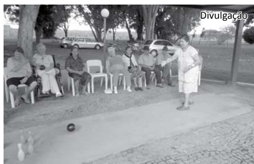
Idosos jogam boliche, preparando-se para campeonato interno

que também proporciona, além da descontração, um trabalho de psicomotricidade”, explicaram as profissionais envolvidas