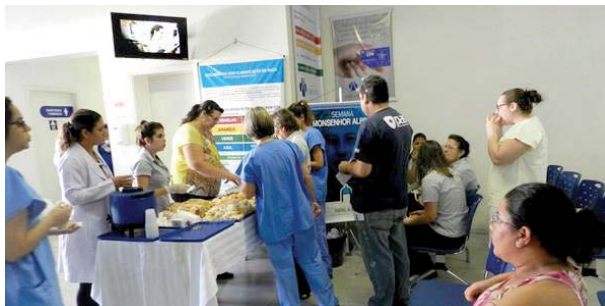
Hospitais Padre Albino e Emílio Carlos - café da manhã e apresentação da vida e obra de Padre Albino.