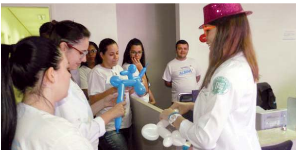
PAS - atividade com beneficiários na recepção.