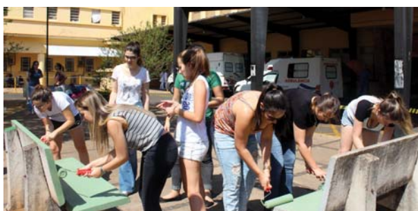
Curso de Medicina: revitalização da área externa do Hospital Emílio Carlos.