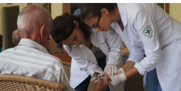
Curso de Biomedicina: Lar São Vicente de Paulo - realização de exames nos internos.