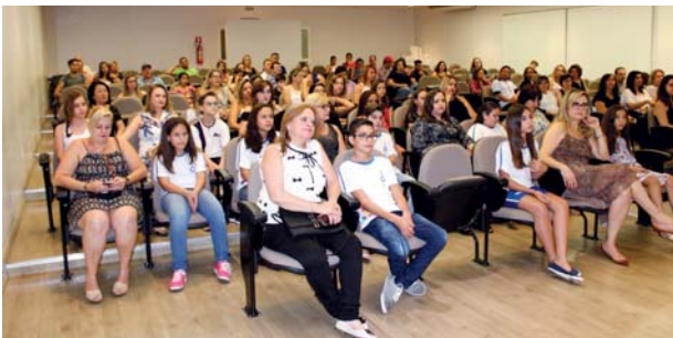
Colégio Catanduva: concurso de redação sobre Padre Albino.