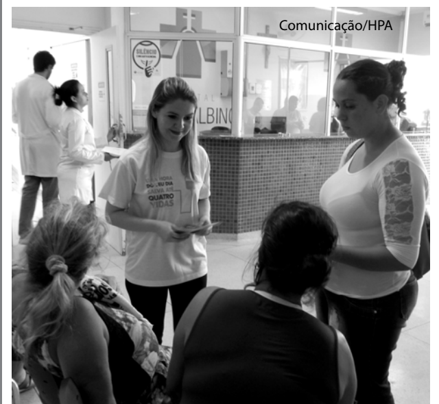
O material da campanha foi distribuído nos hospitais.

Entre os materiais produzidos, camisetas, banners, folhetos, materiais digitais, entre outros. Para mais informações sobre a doação de sangue é necessário entrar em contato com o Hemonúcleo Catanduva, localizado na Rua Treze de Maio, 974, no Centro, ou por meio do telefone 17 3522 7722.