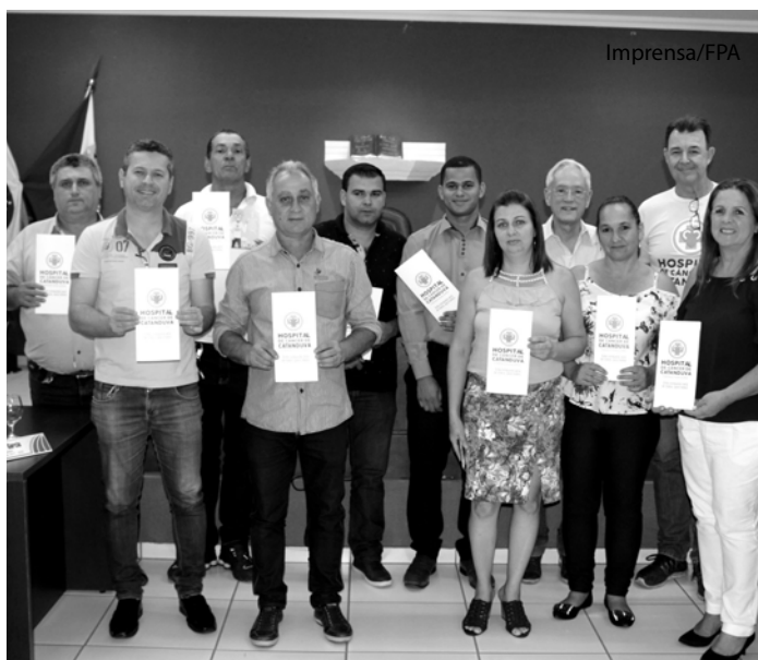
Vereadores de Catiguá vão apoiar o HCC.