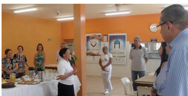
Recanto Monsenhor Albino: chá para os benfeitores.