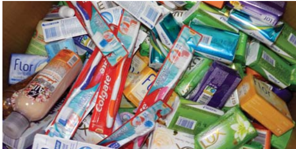
PAS - arrecadação de produtos de higiene pessoal para doação.