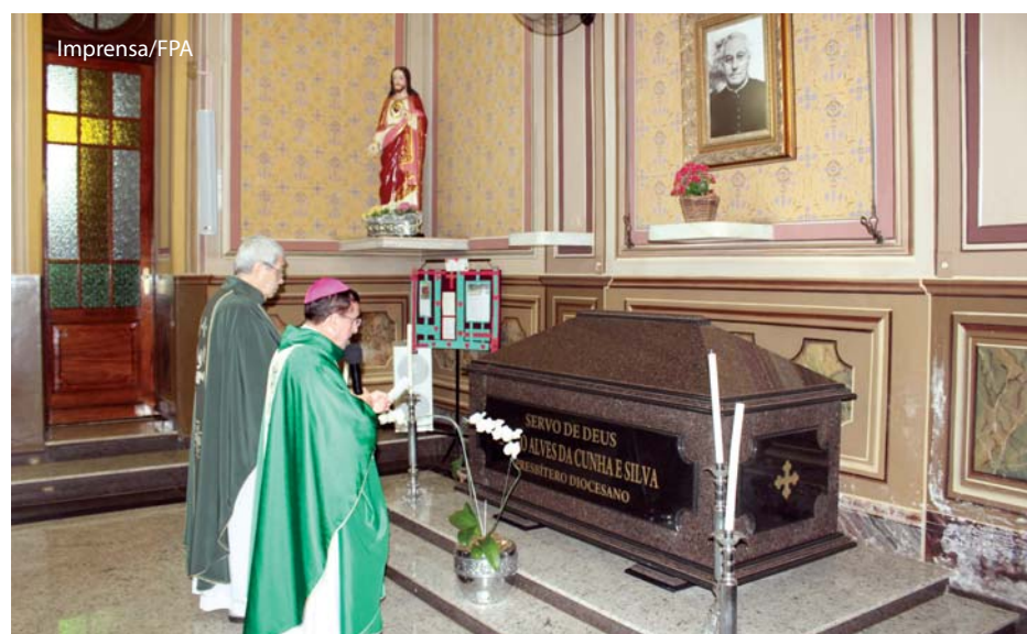
Na missa de abertura, oração pela beatificação diante do sarcófago de Padre Albino.

IMAGENS A Fundação Padre Albino realizou de 17 a 23 de setembro a XXVI Semana Monsenhor Albino para reverenciar a memória deste que foi o maior benfeitor de Catanduva. A programação elaborada pelos Departamentos da Fundação incluiu atividades diversas durante a semana. Veja imagens de algumas atividades na última página e detalhes na próxima edição.