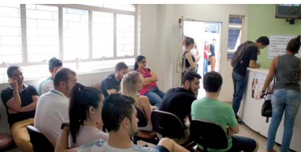
Curso de Administração: doação de sangue.