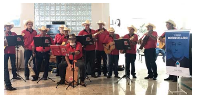
AME: apresentação da orquestra de viola caipira Novo mundo.