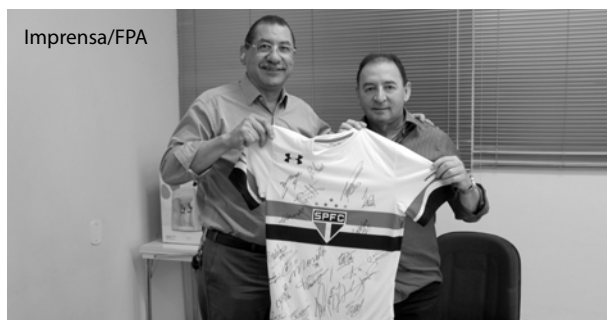
A camisa foi doada para o leilão pró HCC.