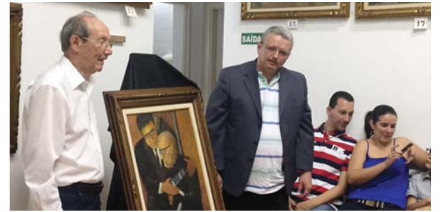
Nova tela para o Museu Padre Albino.