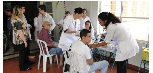
Hospitais Padre Albino e Emílio Carlos - atividades de prevenção em saúde.