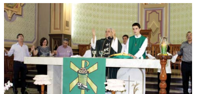
Missa de encerramento da Semana.