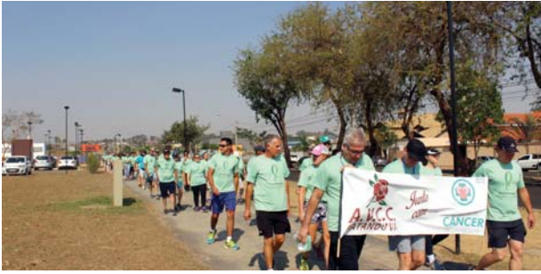
II Caminhada contra o câncer.