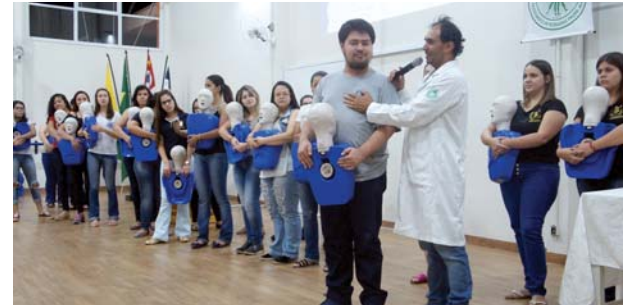
Curso de Pedagogia: palestra sobre primeiros socorros e acidentes no ambiente escolar.