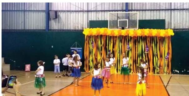
Colégio Catanduva: show de talentos.