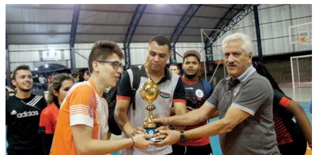
Cursos de Educação Física: Troféu FIPA.