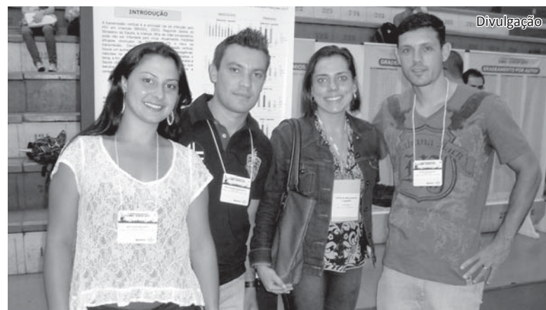
Alunos da Educação Física e o trabalho classificado

sos públicos, para os hospitais filantrópicos, promover a assistência digna e humanizada à saúde é um desafio diário. Sendo assim, toda ajuda é muito bem-vinda", afirma. A administração anseia, cada vez mais, poder contar com a ajuda da sociedade.