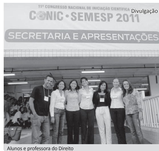
Alunos e professora do Direito