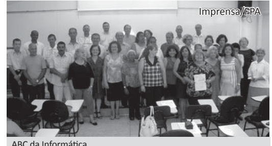
ABC da Informática