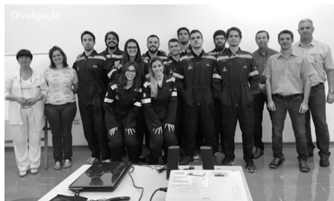
Integrantes da Liga do Trauma com diretores da Cocam no ato da entrega dos macacões.

A Liga de Cirurgia de Urgência e Trauma "Luiz Fernando de Almeida Maia" do curso de Medicina da FIPA,