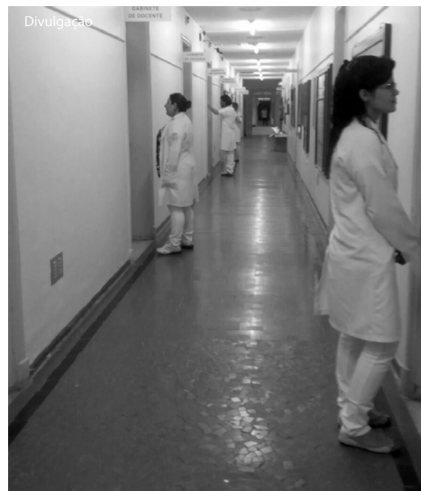
Os alunos no corredor diante da sala onde serão avaliados.

A Liga de Imunologia Clínica e Aplicada (LICA) do curso, em parceria com Student Chapter, realizou dia 25 de março, no Câmpus Sede, o curso "Células imunes