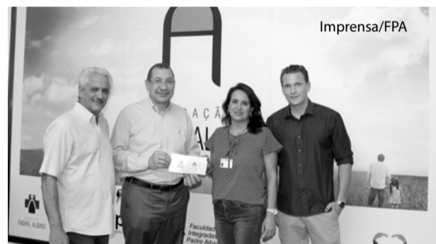
Cursos de Educação Física doam ao HCC.