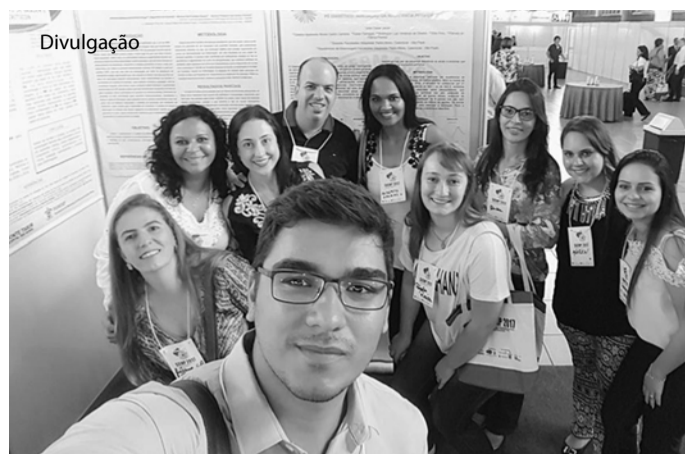
Alunos diante do trabalho premiado.