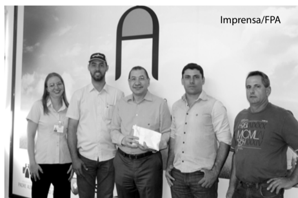
Organizadores entregam a doação.