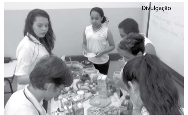
Atividade iniciou o conteúdo nutrição.