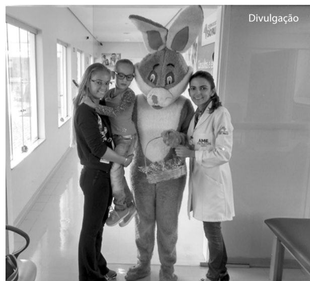
O coelhinho distribuiu ovos de chocolate para clientes interno e externo.

A partir das 8h00 o coelhinho entregou ovos de chocolate para clientes interno e externo.