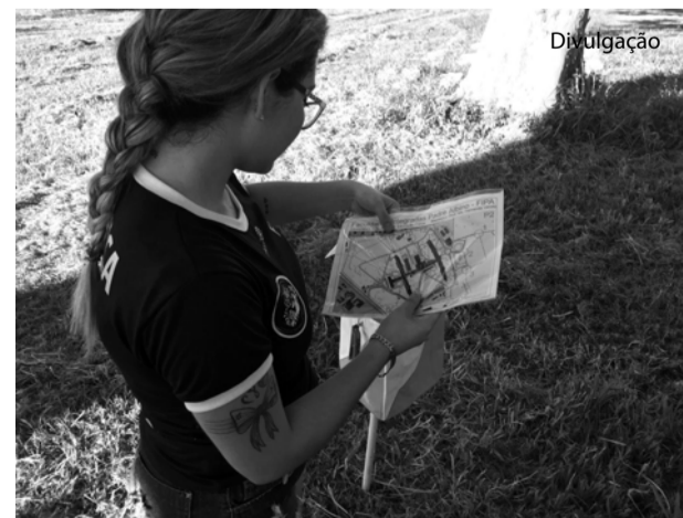
Participante do curso observa mapa.

O Prof. Fernando Varoto informou que no dia 04 de junho, das 9h00 às 12h00, na Fazenda Experimental de Pindorama, vai ser realizada a 1ª Corrida de Orientação Solidária da FIPA.