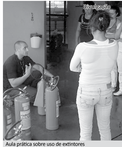
Aula prática sobre uso de extintores

O Serviço Especializado em Segurança e Medicina do Trabalho (SESMT) da Fundação promoveu neste mês de agosto um curso de Brigada de Incêndio para os funcionários do Recanto Monsenhor Albino.