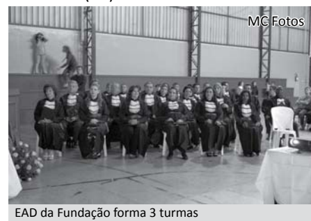
EAD da Fundação forma 3 turmas

A formatura foi on line, conduzida da sede da Unopar, em Londrina (PR).