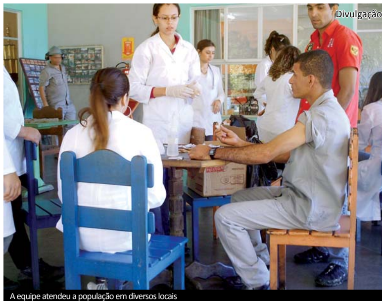
A equipe atendeu a população em diversos locais

O Comitê de Catanduva da IFMSA/Brazil (representante no Brasil da Federação Internacional de Associações de Estudantes de Medicina), formado por alunos do curso de Medicina das FIPA, está organizando a 38ª Assembleia Geral e 4º Encontro PRÉ-AG da entidade, que será realizado em Catanduva entre 08 e 12 de outubro próximo. Página 09.