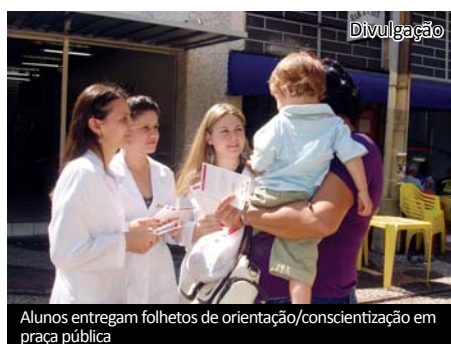
Alunos entregam folhetos de orientação/conscientização em praça pública

A Fundação Padre Albino, através das Faculdades Integradas Padre Albino, da Liga de Pediatria, da IFMSA Brazil e do Banco de Leite Humano do Hospital Padre Albino, realizou, em agosto, atividades para marcar a Semana Mundial do Aleitamento Materno. Página 11.