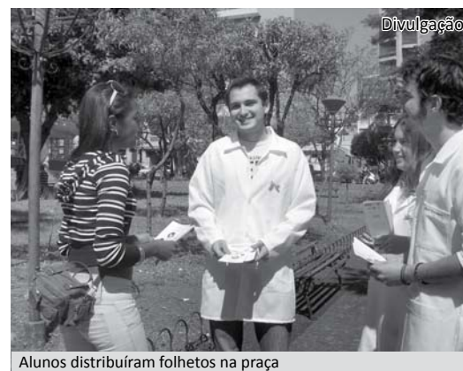
Alunos distribuíram folhetos na praça

incentivo, melhorando a difusão do conhecimento e formação de agentes multiplicadores. O tema deste ano, de acordo com ela, foi amplo e permitiu abordar não somente assuntos específicos da amamentação, mas questões que norteiam a garantia da prática para a mãe e o bebê.