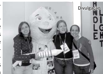
Alunos da Medicina na Assembleia em Joinville/2009