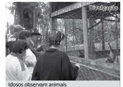
Idosos observam animais

Os próximos passeios serão em setembro, na Semana do Idoso, realizada anualmente pela Equipe Multiprofissional do Recanto.