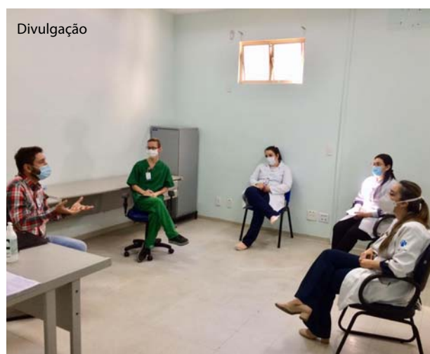
O treinamento respeitou as regras de segurança.