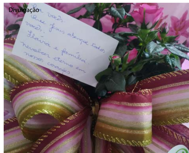
Flores para agradecer o carinho recebido.