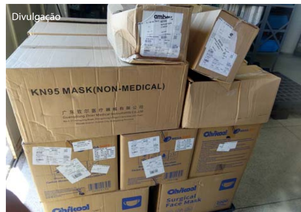
O Estado doou dois tipos de máscaras e protetores faciais.

A Fundação Padre Albino recebeu doação de 22 mil unidades de máscaras cirúrgicas descartáveis, 3.200 unidades de máscaras respiratórias NR95 e 400 protetores faciais incolores, que serão utilizados nos setores de atendimento da Unidade para Respiratórios Agudos/URA. As doações são do Governo do Estado de São Paulo e foram encaminhadas pelo Departamento Regional de Saúde de São José do Rio Preto (DRS-XV) para os hospitais que estão atendendo suspeitos e confirmados da COVID-19.