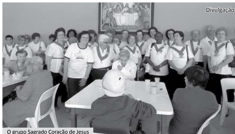
O grupo Sagrado Coração de Jesus

O Apostolado promoveu um período de oração na capela do Recanto, seguido de confraternização com os idosos no refeitório e apresentação da quadrilha da Terceira Idade.