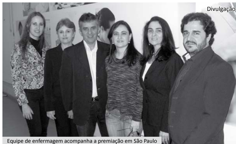
Equipe de enfermagem acompanha a premiação em São Paulo

A Fundação investe ainda na segurança do paciente, no gerenciamento de risco e nas ações continuadas sempre com a finalidade de aprimorar a qualidade da assistência ao paciente.