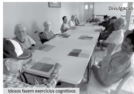
Idosos fazem exercícios cognitivos

A primeira, Exercício Cognitivo, foi realizada através de um dominó colorido adaptado para trabalhar a concentração e raciocínio. Na segunda, Exercício Psicomotor, com