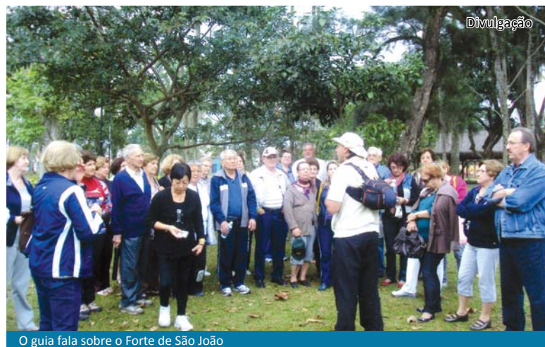
O guia fala sobre o Forte de São João

A Faculdade da Terceira Idade do curso de Educação Física das FIPA realizou uma viagem à Colônia de Férias do SESC em Bertiooga no período de 08 a 12 de agosto último. Página 09.