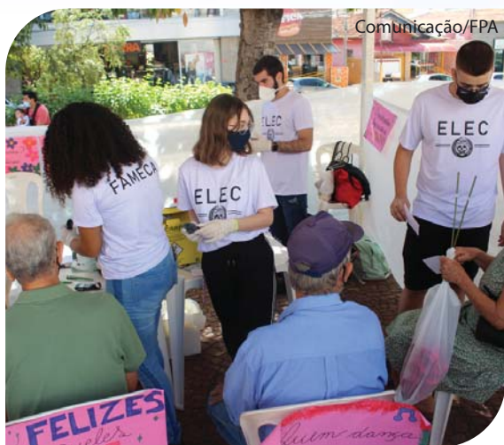
Muitas pessoas foram à praça para exames e orientações.

Com a preocupação de promover integração entre acadêmicos da área de saúde e a comunidade, os alunos do curso de Medicina Unifipa/Fameca realizaram o ELEC – Encontro de Ligas Estudantis de Catanduva, primeira edição presencial desde o início da pandemia. O encontro aconteceu no dia 4 de junho das 8h às 14h, na praça Monsenhor Albino, atraindo a população com informações sobre saúde, higiene, serviços de aferição de pressão e