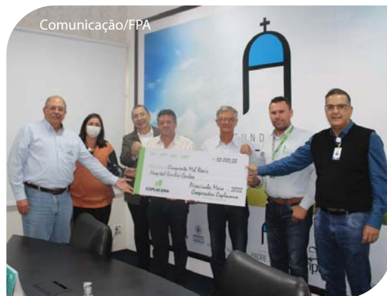
Foi a segunda doação da Coplacana à FPA.