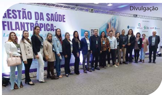
A diretoria e parte dos colaboradores que participaram do congresso.