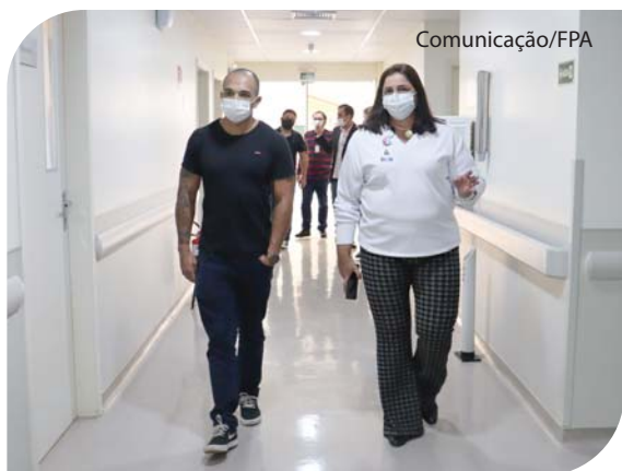
O deputado visita o Serviço de Radioterapia do HCC.

Em visita para compromissos na região, o deputado estadual Douglas Garcia (Republicanos)