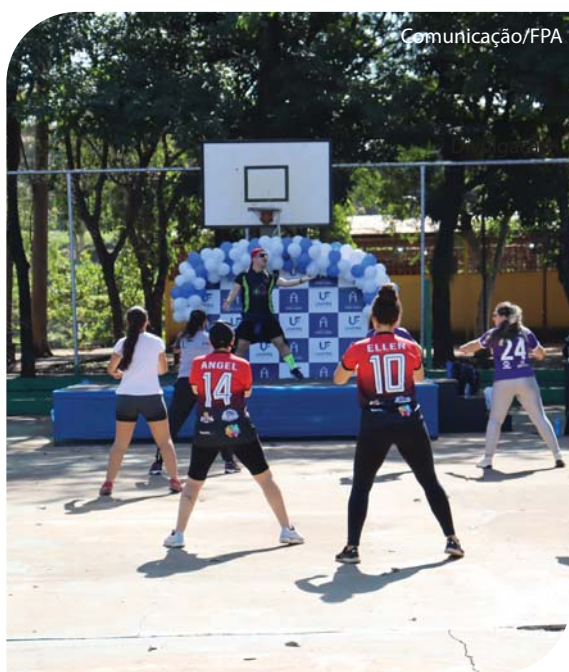
Entre as atividades oferecidas à população, atividades de fitdance e zumba.

O 2º “Movimento e Saúde Unifipa” foi realizado no dia 28 de maio no “Conjunto Esportivo Anuar Pachá”, promovido pelo curso de Educação Física, com apoio da Prefeitura de Catanduva e da Secretaria Municipal de Esportes, Lazer e Turismo (SMELT).