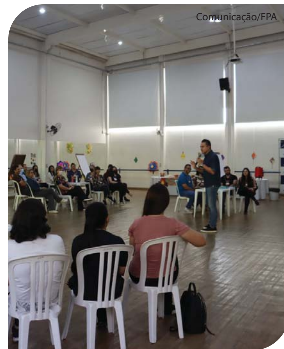
Os participantes, divididos em grupos, participaram de desafios e dinâmicas.