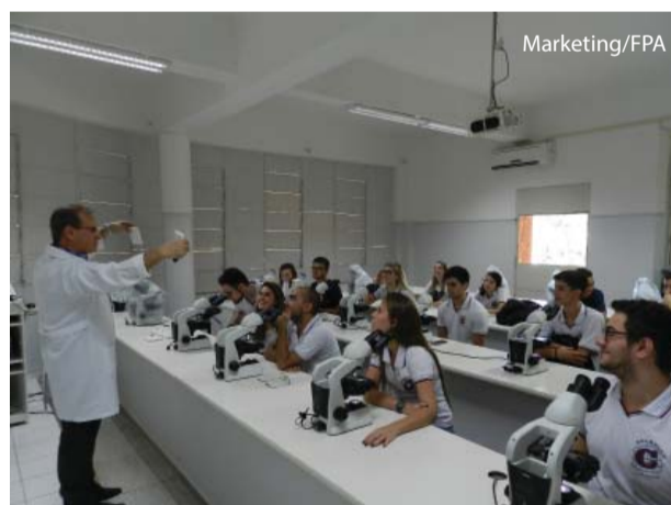
Os alunos conheceram as instalações e tiveram aula prática.

As escolas interessadas na visita devem fazer contato pelos fones 3311-3364 (Silene) ou 3311-3340 (Profa Ana Paula).