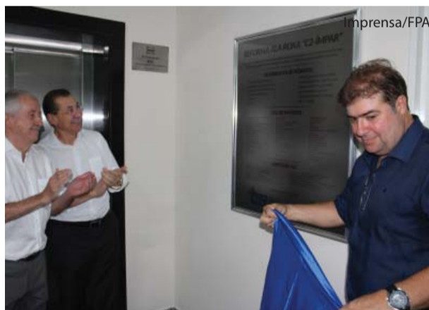
Descerramento da placa de inauguração.