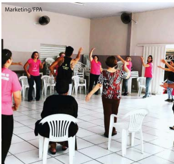
As atividades são realizadas na ONG Sempre Viva.