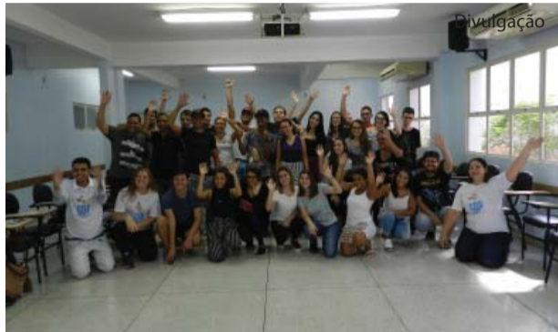
Grupo formado para o primeiro módulo.

O Grupo de Desenvolvimento Profissional (GDP), projeto de extensão do curso de Administração da UNIFIPA, iniciou suas atividades no dia 23 de março. O