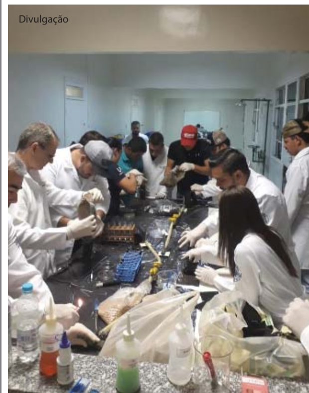
A atividade foi desenvolvida com alunos do 2º ano.

Os alunos isolaram esses microrganismos, sobretudo na cultura da soja, que são excelentes simbiotes com Bactérias Fixadoras de Nitrogênio (FBN) para avaliar o crescimento e desenvolvimento e também a viabilidade dessas bactérias coletadas em plantios de soja da região.