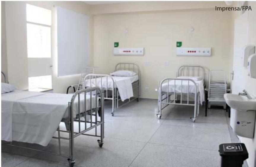
Um dos quartos reformados.

Na manhã do dia 29 de março foi inaugurada a Ala Roxa do Hospital Emílio Carlos, reformada pela AEC – Associação de Assistência ao Hospital Emílio Carlos. As melhorias na Ala foram realizadas por meio de eventos e doações captadas pela AEC, com contrapartida da Fundação Padre Albino, num investimento total de R$ 550 mil.