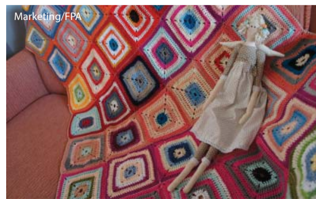
O ateliê tem inúmeras opções para presentes.

O ateliê funciona as segundas e quartas-feiras das 14h às 17h, com mimos para casa, escritório e ótimas opções para presentear. O ateliê também aceita encomendas para festas, empresas e datas especiais. Toda a renda do Ateliê Amor ao Próximo é destinada ao HCC.