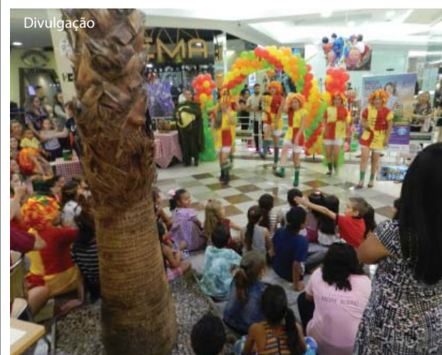
As Emílias encantaram novamente as crianças.

Mais de 20 crianças participaram da comemoração que homenageou Monteiro Lobato; elas também foram informadas sobre a importância do escritor para a literatura infantil.