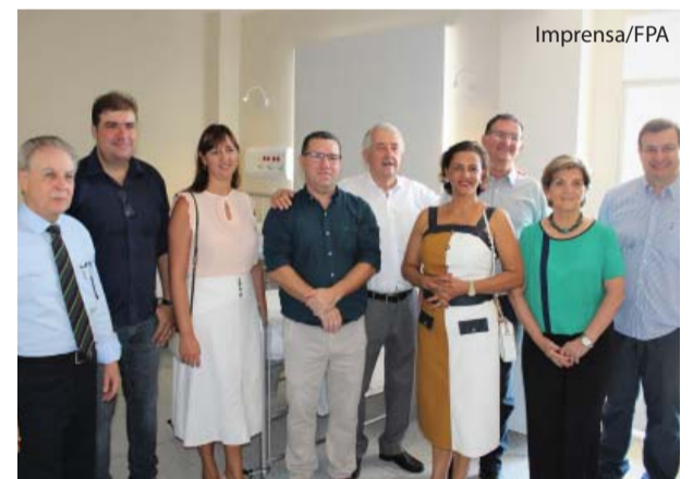
Membros da AEC presentes à inauguração.