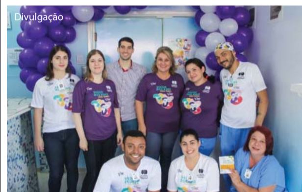
A equipe orientou pacientes e acompanhantes.