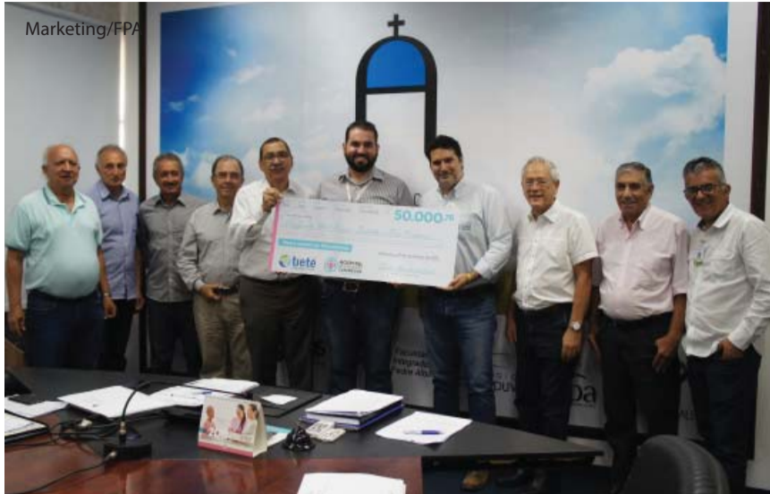
Entrega do cheque simbólico pela Usina à Fundação.

A Tietê Agroindustrial doou R$ 50 mil ao Hospital de Câncer de Catanduva (HCC). A entrega foi realizada no dia 13 de novembro com a participação de membros da