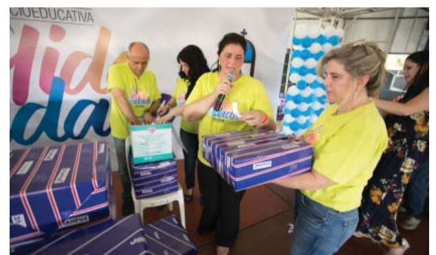
Sorteio de prêmios.