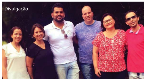
Os egressos com os docentes que participaram do congresso.

fundamental acompanhar e manter o relacionamento contínuo com os egressos, objetivando potencializar a troca de informações e o acompanhamento da inserção no mercado de trabalho, além de fortalecer o Programa de Acompanhamento de Egressos do curso de Enfermagem da UNIFIPA", disseram.