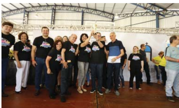
Equipe Preta - 3º lugar.