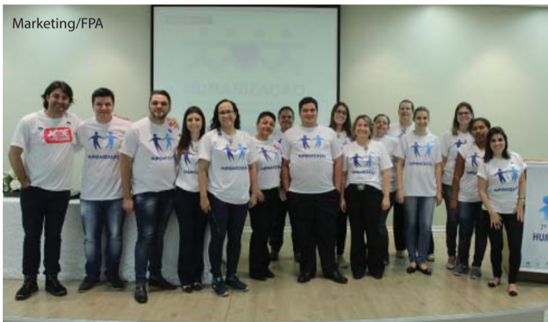
Os funcionários promotores da Semana.

Os hospitais Emílio Carlos e Padre Albino, em parceria com o Ambulatório Médico de Especialidades/AME Catanduva, Centro Universitário Padre Albino/UNIFIPA, Padre Albino Saúde e Recanto Monsenhor Albino, promoveram, gratuitamente, o 7º Simpósio de Humanização nos dias 23, 24 e 25 de outubro no Anfiteatro Padre Albino. A intenção da equipe organizadora foi difundir o conceito das políticas nacional e estadual de humanização e sensibilizar os profissionais de saúde da região.