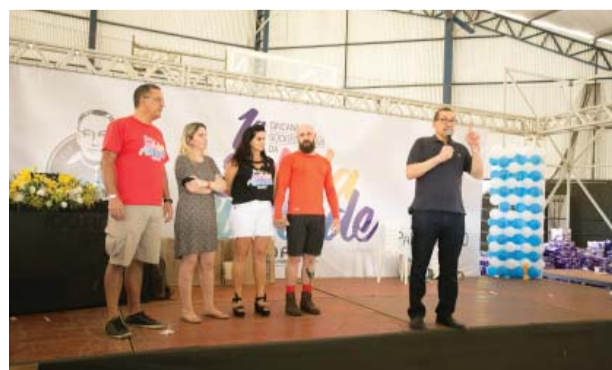
Agradecimento aos organizadores da festa.