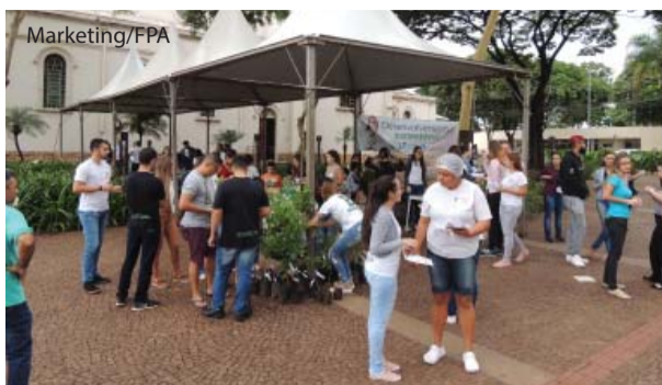
Os alunos apresentaram trabalhos e orientaram a população.