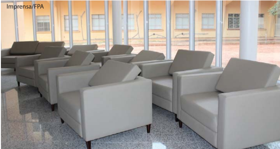
Poltronas confortáveis para o hall de entrada.

Os móveis funcionais, poltronas, armários, mesas e arquivo deslizante já estão em processo de montagem e instalação no Serviço de Radioterapia/HCC da Fundação Padre Albino. O estacionamento para veículos está em fase de conclusão. Página 11.