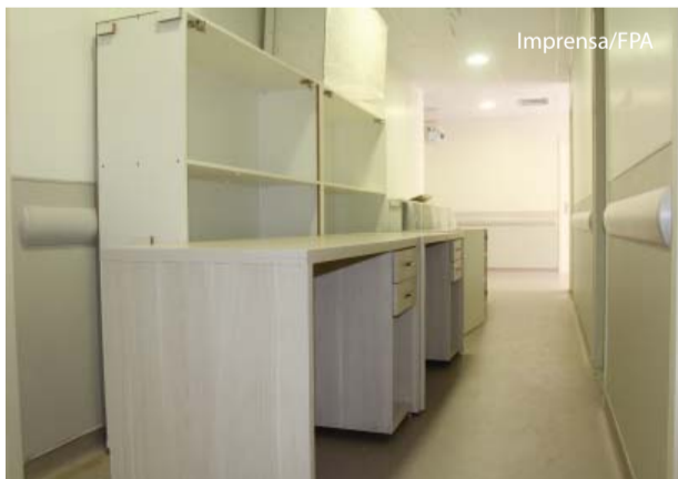
Os móveis estão em processo de montagem.

A previsão é de que as obras estejam finalizadas entre janeiro e fevereiro de 2019.