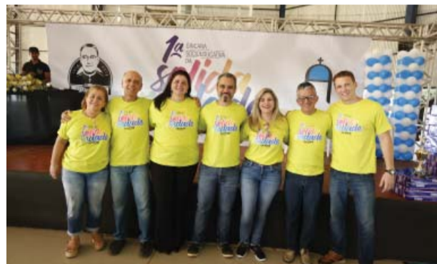
Comissão organizadora da gincana.