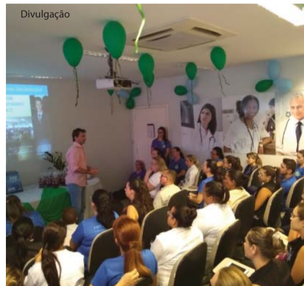
Uma das muitas atividades da SIPAT do AME.

AME ao próximo O AME continua com sua campanha para reduzir a falta dos pacientes agendados para consultas e exames. O projeto "AME ao próximo" foi desenvolvido nas cidades de Urupês, no dia 05 de dezembro, e em Fernando Prestes, no dia 12, ambos das 8h00 às 15h00. As pessoas foram orientadas através de banner, filipeta, faixa e música sobre a importância do cancelamento da consulta, exame ou retorno com três ou quatro dias de antecedência para que outra pessoa possa aproveitar a vaga.