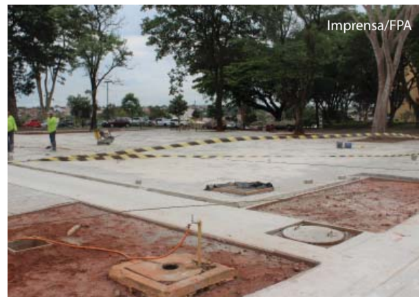
Falta apenas a jardinagem no estacionamento.