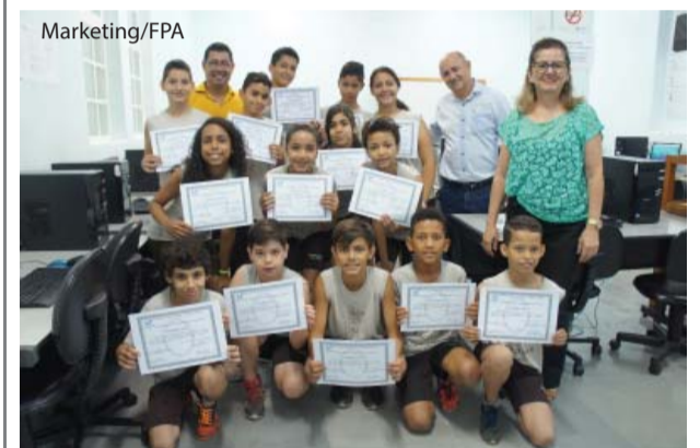
Mais uma turma do projeto Informática inclusiva para crianças.