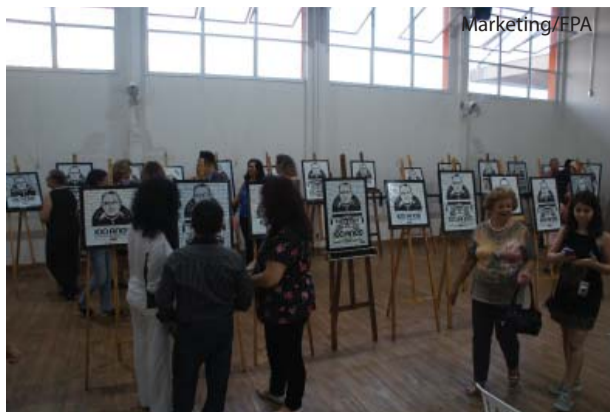
Os 28 mosaicos preservam data importante para a Fundação: 100 anos da chegada de Padre Albino a Catanduva.

A segunda homenagem foi para os amigos do HCC. Desde 25 de fevereiro de 2016, quando lançou a campanha de captação de recursos para o Serviço de Radiote-