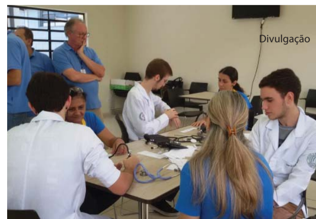
Ação na SAEC atende 122 funcionários.