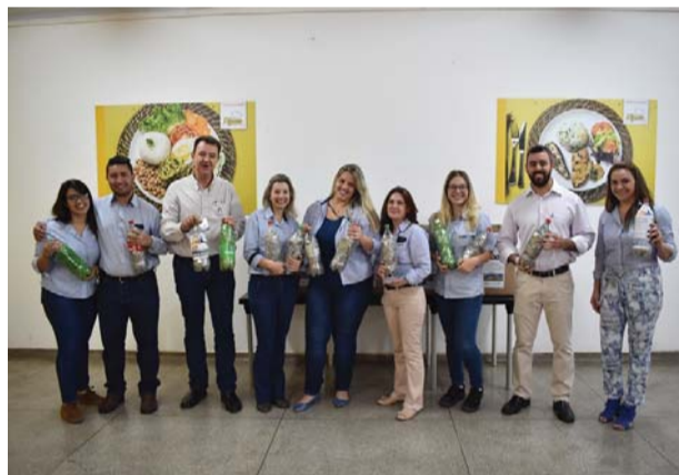
As Indústrias Colombo arrecadaram lacres para o HCC.