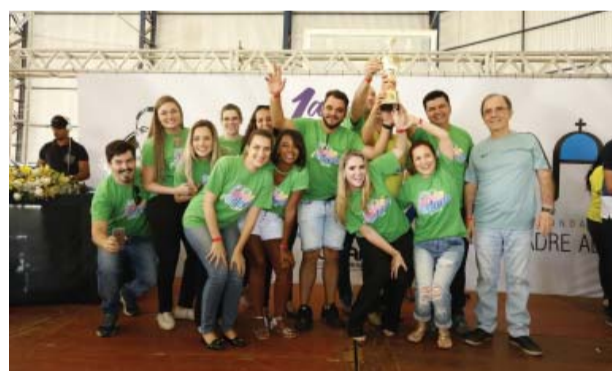
Equipe Verde - 2º lugar.