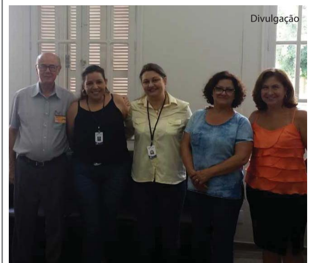
Os membros da CIPA São Francisco 2018-2019.