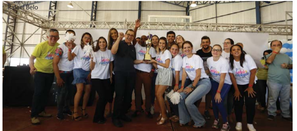
Equipe Branca, campeã da gincana interna, recebe seu troféu.