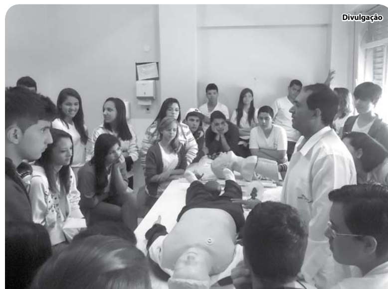
Nas visitas, os alunos conhecem a maioria dos laboratórios das FIPA