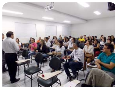
A primeira aula do curso