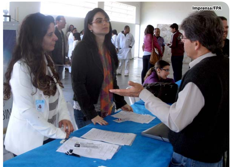
A Fundação cadastrou 20 pessoas com deficiência

Atividade cadastra pessoas com deficiência interessadas em ingressar no mercado de trabalho