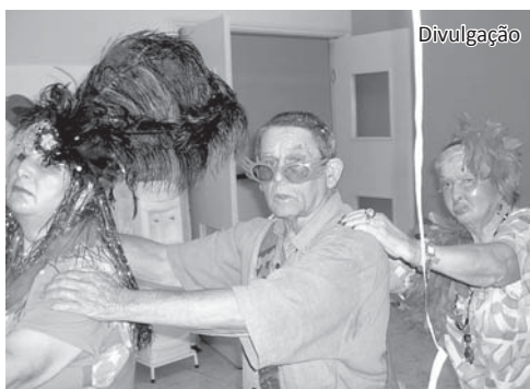
Os idosos se vestiram à caráter e caíram na dança

profissional do Recanto promoveu mais um baile de carnaval para os idosos, das 15h00 às 17h00.