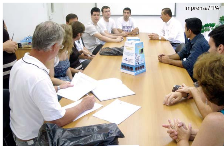
Comissão de Fiscalização acompanha todos os sorteios

Ano 2070. Acabo de completar 50 anos, mas a minha aparência é de alguém de 85. Tenho sérios problemas renais porque bebo pouca água. Creio que me resta pouco tempo. Página 04.