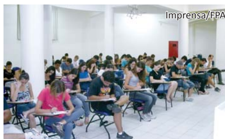
237 candidatos disputaram as 80 vagas do cursinho

O cursinho preparatório Sala Extra recebeu 283 inscrições para o seu processo seletivo de 2011. Foi o maior número de inscritos já registrado desde o início do cursinho. Página 06.