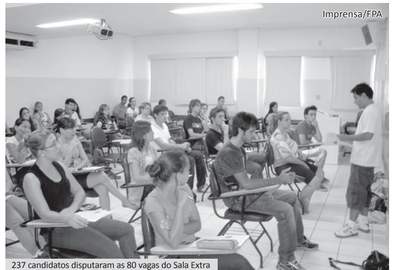
237 candidatos disputaram as 80 vagas do Sala Extra

O Sala Extra é uma parceria entre o curso de Medicina, as FIPA, o Centro Acadêmico Emílio Ribas, a Fundação Padre Albino e a Secretaria de Educação de Catanduva.