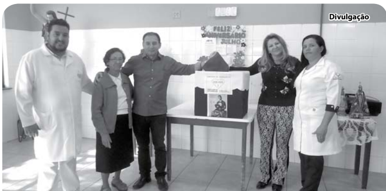
O Recanto entregou agasalhos arrecadados pelos seus funcionários.

A população terá à disposição, entre outros, exame de percentual de gordura; avaliação postural; tipagem sanguínea; exames para detecção de anemia e de colesterol; sorteios; orientação para a terceira idade; prevenção de doenças renais, de queimaduras, do câncer do colo do útero, mama e próstata; teste de diabetes; aferição de pressão arterial; índice de massa corpórea; orientação nutricional e postural. Todas as atividades são gratuitas, inclusive os exames, sendo que as pessoas sairão da praça com os resultados e orientadas, se necessário.