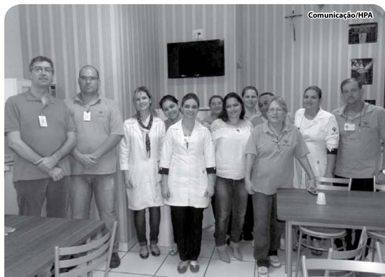
Os novos membros da CIPA do HPA.