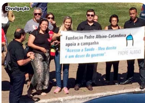
Fundação levou faixa de apoio ao Movimento.