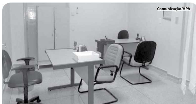
O ambiente ficou agradável e mais tranquilo.

O atendimento telefônico integra um conjunto de serviços da instituição e é um dos recursos comunicacionais que pode contribuir decisivamente para a satisfação do cliente através de um atendimento rápido e que transmita imagem profissional de eficácia, eficiência e capacidade organizacional.