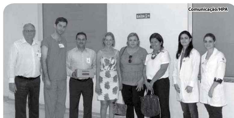
Enfermagem e Administração do HPA com as senhoras da Casa da Amizade.

A equipe multidisciplinar é convidada a aderir à comemoração junto aos organizadores do projeto e pacientes.