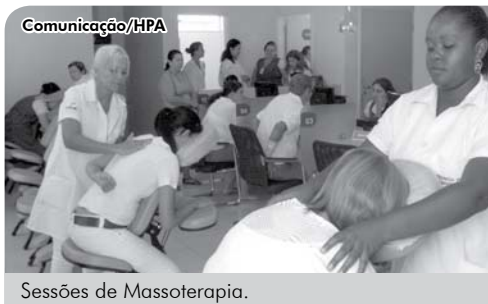
Sessões de Massoterapia.

da Mulher, celebrado no dia 8 de março. Na ocasião, o plano em parceria com o Senac Catanduva ofereceu atividades de promoção da saúde da mulher.