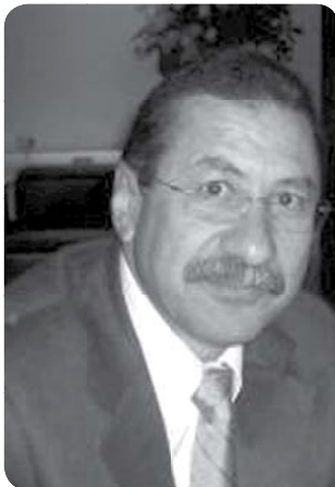
Imagem e realidade

Há alguns anos, propaganda de empresa de refrigerantes veiculada na mídia televisiva insistia que "sede é tudo, imagem não é nada". Pretendia certamente descaracterizar peça publicitária do concorrente que supervalorizava a imagem deixando em segundo plano a vontade do consumidor. No caso, a sede de consumir determinado produto. É muito conhecido também um adágio popular que diz "a mulher de César não basta ser honesta, tem que parecer honesta", cuja mensagem objetiva caracterizar que, muitas vezes, apesar de honesta e correta, essa mensagem nem sempre chega assim às outras pessoas.