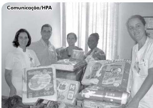
Equipe multidisciplinar do HPA recebe a doação