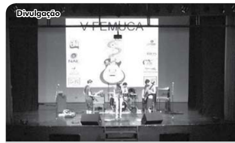
O FEMUCA arrecadou 400 quilos de alimentos.

A banda The Gambiarras foi a vencedora do V FEMUCA – Festival de Música de Catanduva realizado dia 23 de fevereiro, às 14h45, no Teatro Municipal Aniz Pachá, promovido pelo o L.I.E.U. (Local de Integração e Expressão Universitária) do curso de Medicina das FIPA. Em segundo lugar ficou a banda N-Way e em terceiro a banda 20 Eyes.