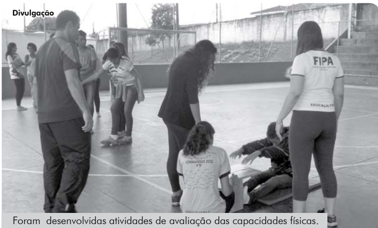
Foram desenvolvidas atividades de avaliação das capacidades físicas.

Dia 13 de março, durante as aulas da disciplina "Curiosidades científicas" da EE Dr. Nestor Sampaio Bittencourt, de Catanduva, os alunos do 1º ano do curso de Licenciatura em Educação Física das FIPA desenvolveram atividades de avaliação das capacidades