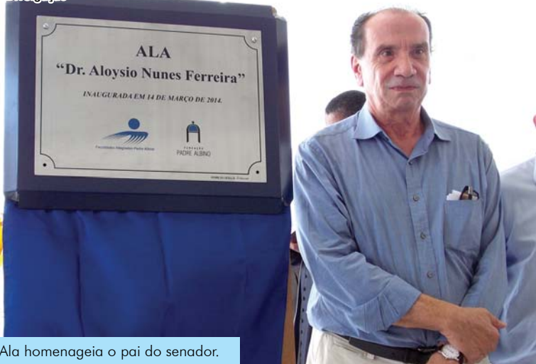
Ala homenageia o pai do senador.

O senador Aloysio Nunes Ferreira Filho (PSDB/SP) inaugurou, dia 14 de março, ala com quatro novas salas de aula nas Faculdades Integradas Padre Albino (FIPA). A ala tem o nome de "Dr. Aloysio Nunes Ferreira", pai do senador. Última página.