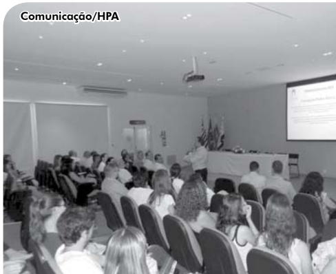
Equipe multidisciplinar dos hospitais apresentaram as áreas e esclareceram possíveis dúvidas.

Os hospitais Emílio Carlos e Padre Albino receberam os alunos do quinto e sexto anos do curso de Medicina das FIPA no último dia 3 de fevereiro, a partir das 8h, no Anfiteatro Padre Albino.