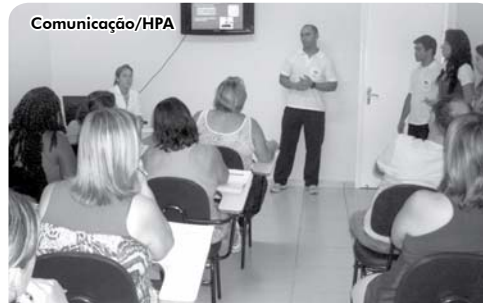
A Medicina Preventiva auxilia os clientes através de orientação médica, palestra e trabalho em grupo.

médica, palestra e trabalho em grupo com a finalidade de controlar doenças pré-diagnosticadas.